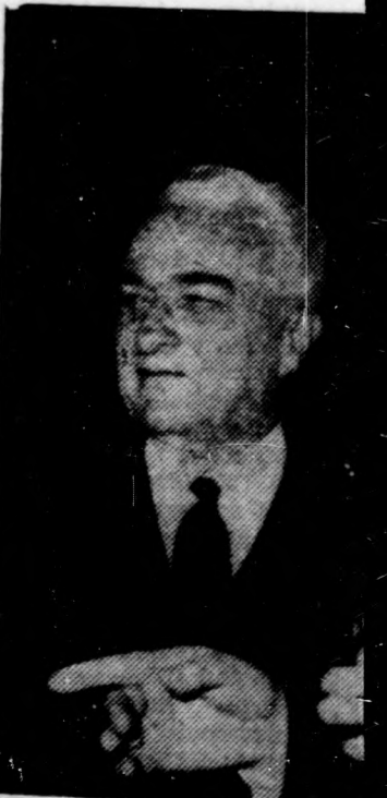
A. Gromiko szovjet külügyi miniszter tájékoztatás

tálta: az ország legkorszerűbb fodrászüzletét nyitották meg a Simonffy utcában — az ilyenek mindig tülkös íze van. Annál kellemesebb volt hát a meglepetésem, amikor a hűsítőipari üzletet a hajamból eltávolítottam, felkerestem az átalakított fodrászüzletet. Nem tudom összehasonlítani, hogy országos viszonylatban vajon hányadik helyet foglalja el, egy azonban vitán felül: valóban szép és korsze-