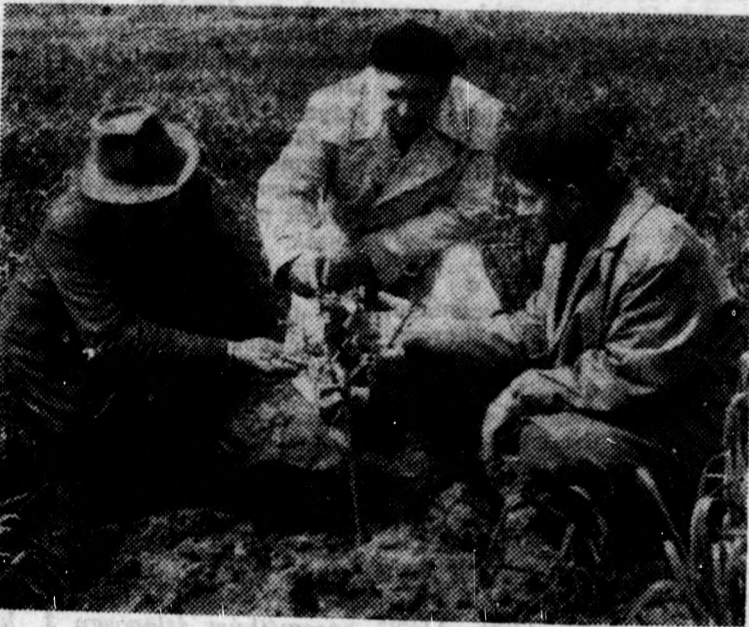
Virágzik a három évvel ezelőtt telepitett őszibarackta

oszán telepitett őszibarack. A szövetkezet vezetői lehajították az egyik szépen fejlődő fás hoz, és gyönyörködve nézték halványlila virágait. Elégedett mosoly suhant az arcukra. Váltakozik, szépül a táj. Jobb életet terem magának a homoki ember.