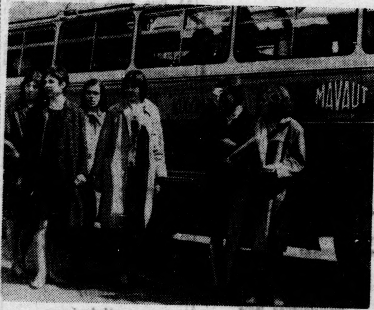
A szeszélyes áprilisi időjárás nem tülságosan kedvez egyelőre a kirándulóknak. A veszprémi közigazgatási technikum tanulóit azonban nem riasztotta vissza sem az eső, sem a nagy távolság — s remélhetőleg sok kedves élménnyel mennek majd haza Debrecenből