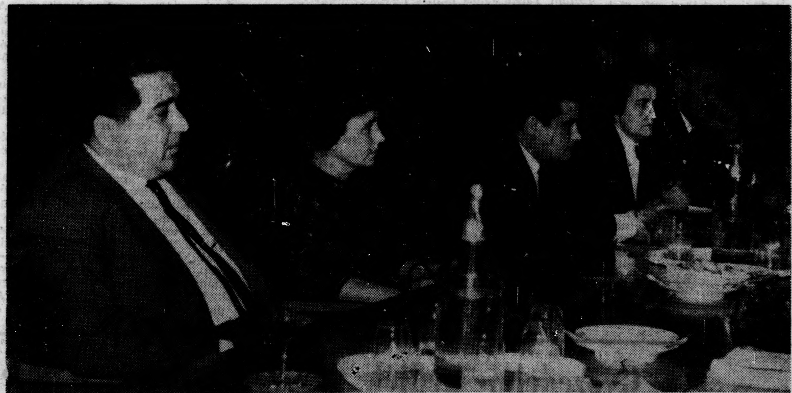
Ülésezik a megyei képviselőcsoport

inak piacutató tevékenysége. A múlt évben 48 különböző árucikk minőségére, méretére, színére, fazonjára vonatkozó vásárlói észrevételeket összegyűjtötték, és a nagykereskedelemben keresztül eljuttatták az iparhoz. Így hozzájárultak ahhoz, hogy az ipar valóban azt termeljen amire legjobban szükség van. Külön örvendetes, hogy a piacutató tevékenység nem korlátozódik csak az áruház vezetőire, hanem ebben a munkában részt vesz minden dolgozó, eladó. „A fogyasztói igények megismerése — folytatta a miniszter — még önmagában nem elegendő. A jó áruforgalmi munkához áru, mégpedig megfelelő összetételű áru van szükség. Ennek biztosításához nagy segítséget nyújtott a nagykereskedelmi vállalatokkal, valamint a ktsz-ekkel kialakított jó kapcsolat. Az áruház szocialista brigádjai és a ktsz-ekben működő brigádok között megkötött szocialista szerződés lényegesen hozzájárult ahhoz, hogy az áruház dolgozói több mint ötmillió forint értékű árut kaptak a szövetszervezetektől. Ez a tevékenység országosan is a legjobbak közé számít. A népgazdasági érdekek érvényesítésére mutatnak a