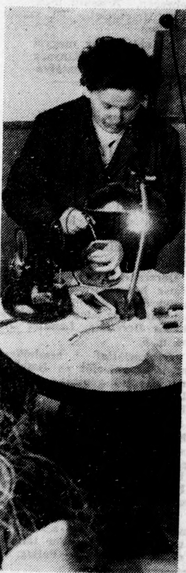
A helyszínen megvárható a harisnyaszemfelszedés

tálta: az ország legkorszerűbb fodrászüzletét nyitották meg a Simonffy utcában — az ilyenek mindig tülkös íze van. Annál kellemesebb volt hát a meglepetésem, amikor a hűsítőipari üzletet a hajamból eltávolítottam, felkerestem az átalakított fodrászüzletet. Nem tudom összehasonlítani, hogy országos viszonylatban vajon hányadik helyet foglalja el, egy azonban vitán felül: valóban szép és korsze-