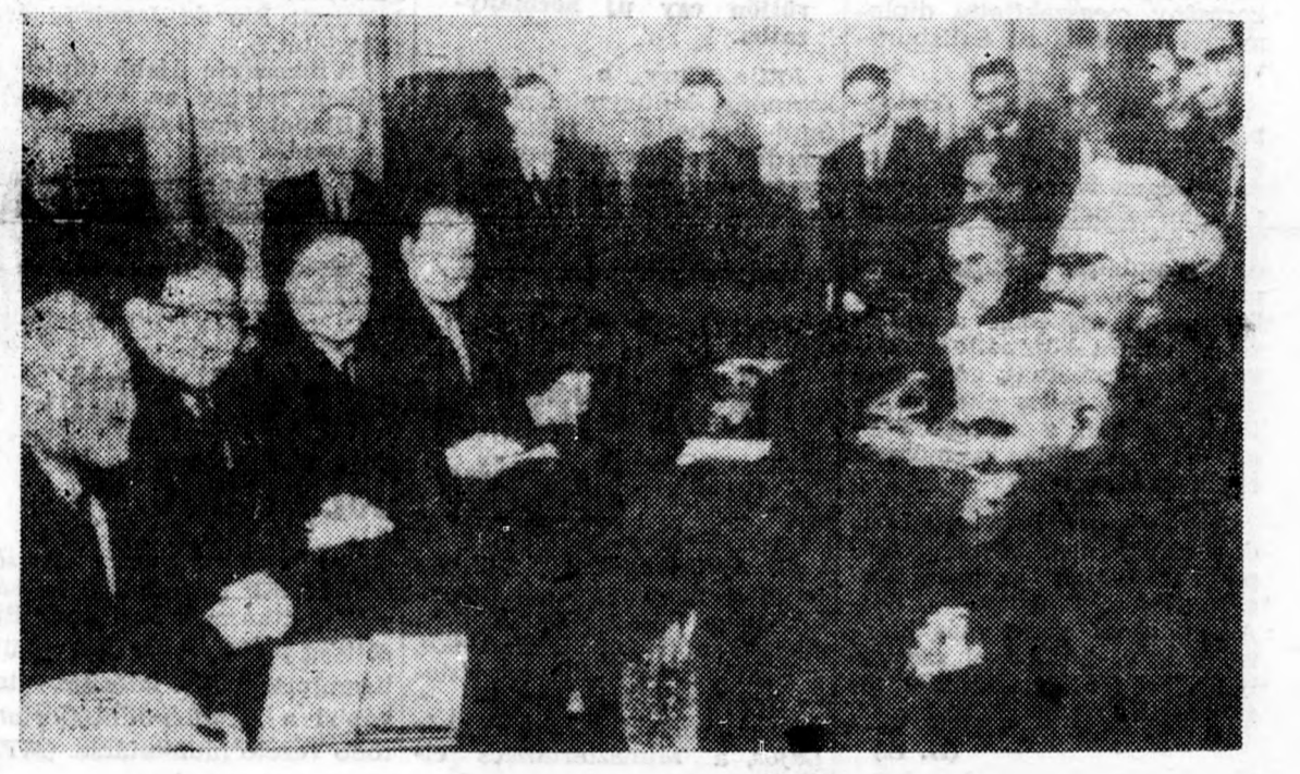
A. Mikojan fogadta Sasztri indiai miniszterelnököt a Kreszlben

Moszkva (TASZSZ) Csütörtök reggel a Kreszlben megkezdődtek Koszigin szovjet és Sasztri indiai miniszterelnök tárgyalásai. Indiai részről Sasztri kíséretének tagjai és Kaul moszkvai nagykövete, szovjet részről Selepin miniszterelnök-helyettes, Patolicsev hatalmas erő a béke és a népek közötti barátság megerősítése szempontjából. — A Szovjetunió igen fontos szerepet tölt be Ázsiában az ottani népek felszabadító harcának támogatása révén, segítséget nyújt a független ázsiai országoknak elmaradott