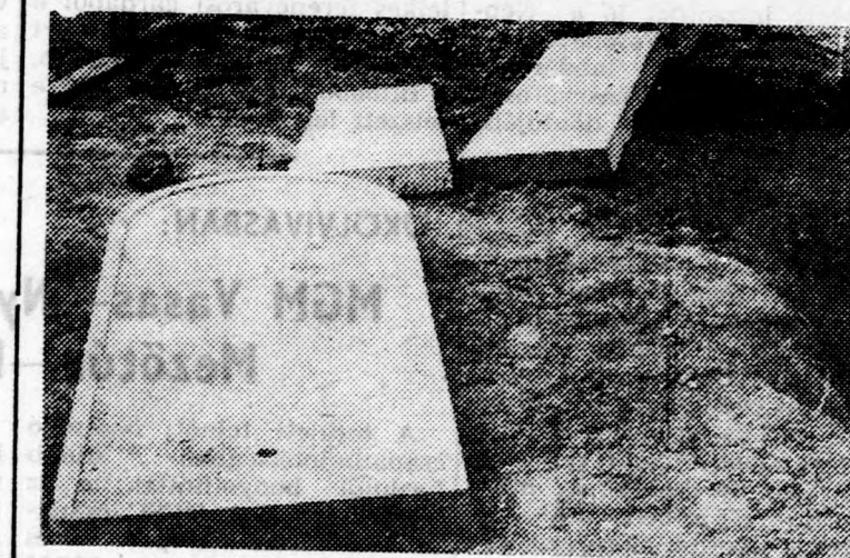
A kiásott boncpad

Tehát egy helyett a har- madik pad készül. Ki fizeti meg a többletköltségeket? A kórház mellé új tanácsi rendelőintézet épült. Ez is szép, modern. Csak ... Közismert, hogy az abla- kokhoz lecsurgó parkányo- kat építenek. Amint a kép mutatja, ezzel is tisztában voltak az építők is. Tisztá- ban voltak, legalábbis az emeleten. Lejjebb a föld- szinten már nem. Így tör- ténhetett, hogy ott foghja- sak az ablakok. Egyik alatt van parkányó, a másik alatt nincs. Most az építők mint- egy utómunkálatként vés- nek, faragnak, toldják a hiányzó részt. Hozzátehetjük, a képek- kel illusztrált helyzethez a következőket. A járási népi ellenőrző bizottság megál- lításai szerint az építkezés során kitermelt föld el- szállításakor igen nagy meny- nyiségű egész téglát is el- szállítottak. Egy magánház udvarára szállított töltő- anyagról, tehát a kitermelt földről megállapították, hogy annak fele egész téglá.