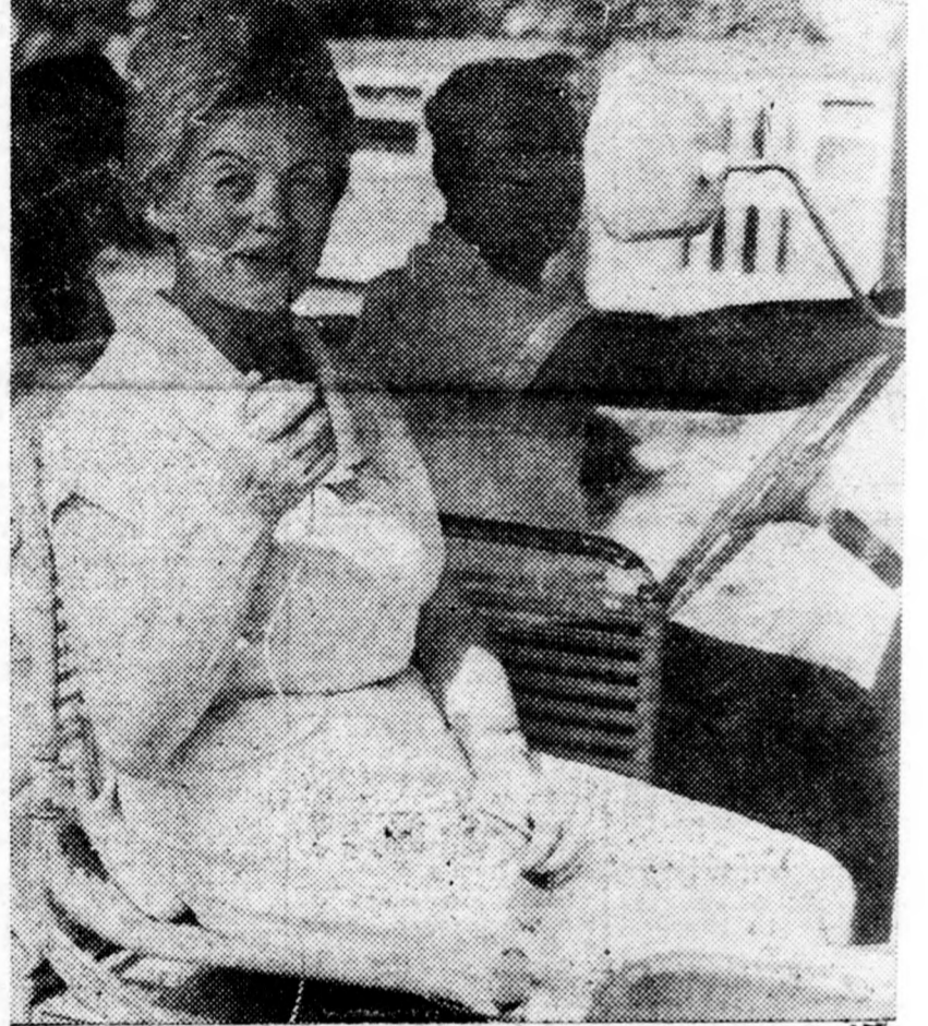
Az idegenvezető munka közben

na. Például az ételek, a borok kiválasztásánál. Ismerni kell a vendégek ízlését, szokásait. Most három éve az ide látogató finn íróval kimentünk Nyírbarbora, onnét Piricsére. Tudtam, hogy nagyon szereti a feketét, s azt is, hogy ott nincs presszó, ahol hozzájut-