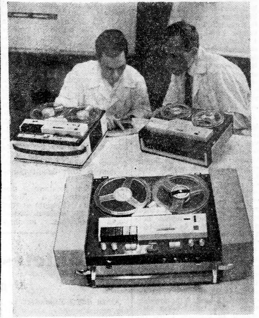
Előtérben az új M-12-es sztereofonikus magnetofon, háttérben: a gyárban tervezett két „kisöccse”, az M-8-as és az M-9-es

ság és az őszinte együttműködés a jövőben is erősödni fog a Szovjetunió és Kambodzsa népeinek javára, a világbéke érdekében. Norodom Sihanuk herceg válaszában megállapítja, hogy a szovjet-kambodzsai kapcsolatok az utóbbi időben a legharmonikusabban fejlődtek, és kifejezte azt a reményt, hogy tovább erősödjék majd a Szovjetunió és Kambodzsa együttműködése minden területen. (MTI)