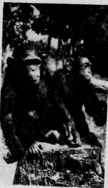
Jólesik a napozás

A mellősi lábukat kézként használó, „emberi” mozdulatokat végző majmokra már az ósidőkben felfigyeltek az emberek, s ezek a sajátos emlősök sok hiedelemnek, misztifikáló tévteóriának szolgálták alapul. Az egyiptomiak a fáraók korában szent állatokként kezelték a majmokat, és a tudományok urának, a könyvtárak őrnökének, Tot (Te-hut) istennek ajánlották őket. A vallásos arabok szemében „tisztátlan erő” megtestesítői, ördögi fajzatok a majmok: el-kárhozott lelkek, akiket az isten büntetett ilyen külsővel. Igaz, Arisztotelész 23 évszázaddal ezelőtt már megjegyezte, hogy a majom „átmeneti forma az ember és az emlősök között”, de csak nem is olyan régen vált bizonyossá, hogy az ember, a munka és az absztrahálmi tudás folytán fejlődött ki az emberszabású majmok családjából származó ősből. Csak ekkor figyeltek fel az orvosok és biológusok igazán az emberi betegségeket és biológiai sajátosságokat hordozó majmokra, mint kísérleti alanyokra. Megtörténtek az első kísérletek majomtelepek alapítására. 1927-ben, a fiatal szovjet