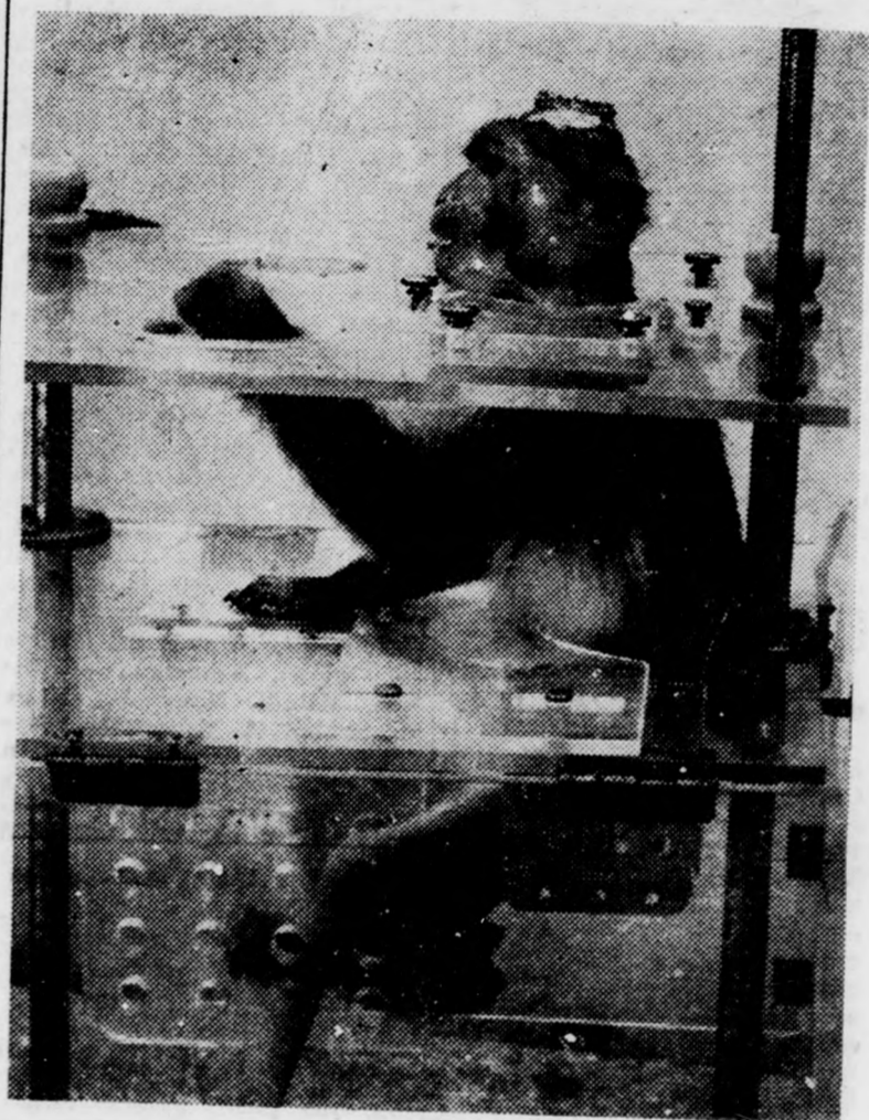
Belőlem még úrhajós is lehet...

A legbájosabbak a majomkölkykők. Egy hónapos korukig az anyjuk hordozza őket: kezdetben a kicsik a mama hasi szőretébe kapaszkodnak, később a hátán lovagolnak nagy peckesen. S ha a kicsik valamelyike kópéságra vetemedik, elcsavarog, a majom mama hosszú farkincájánál fogva húzza vissza, s tanítja illemre a rakoncátlan horkót. No és beszédre, meg luyes nézésre. Nem, nincs semmi tévedés: a páviánok például 20 hangjelet használnak, 7 különféle tekintettel és 10 differenciált mozdulattal fejezik ki érzelmeiket. A jól nevelt, jó családból származó majomnak