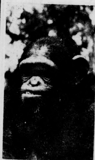
Mosolyogjak? Még mit nem!