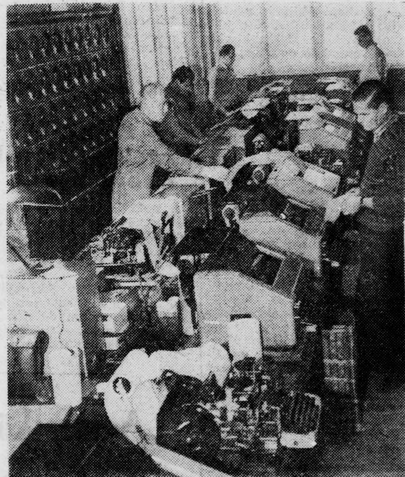
A világ összes meteorológiai intézetével telexkapcsolatban van a Meteorológiai Intézet budapesti központja

Sokan figyelnek a rádió, a tv időjárás-jelentésére, de nem is sejtik mennyi munka és szaktudás van abban a pár sorban, amit felolvassnak. Az időjárás-jelentéshez ismerni kell a talaj szintjéről 30 ezer méter magasságig a hőmérsékletet, a szélirást és a páratartalmat. Új módszerek, módszerek alkalmazásával az időjárás-jelentés 1966-ra — a Meteorológiai Intézet szerint — pontosabb és biztosabb lesz, mint 1965-ben volt.