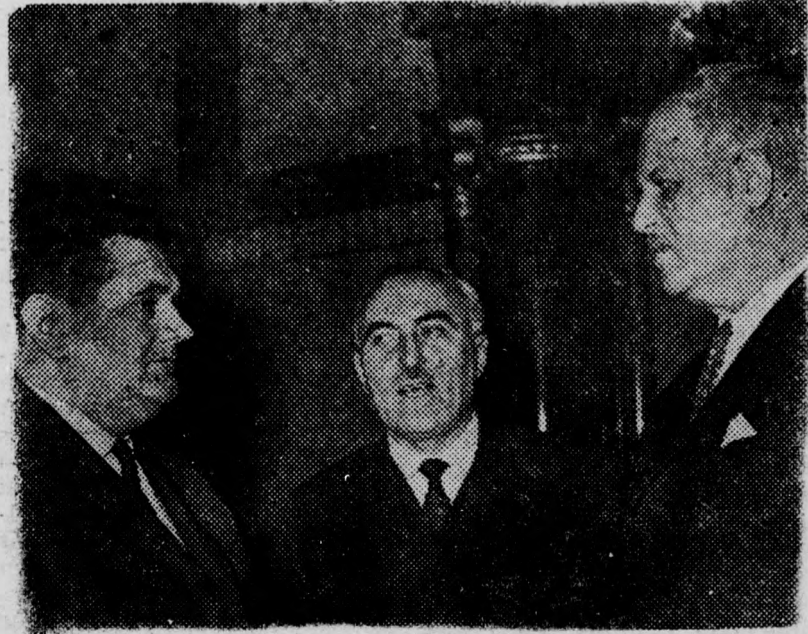
Szabó István Hajdú megyei képviselő, Prantner József, az Állami Egyháziügyi Hivatal elnöke és Tömpe István, a Magyar Rádió és Televízió elnöke az országgyűlés szünetében