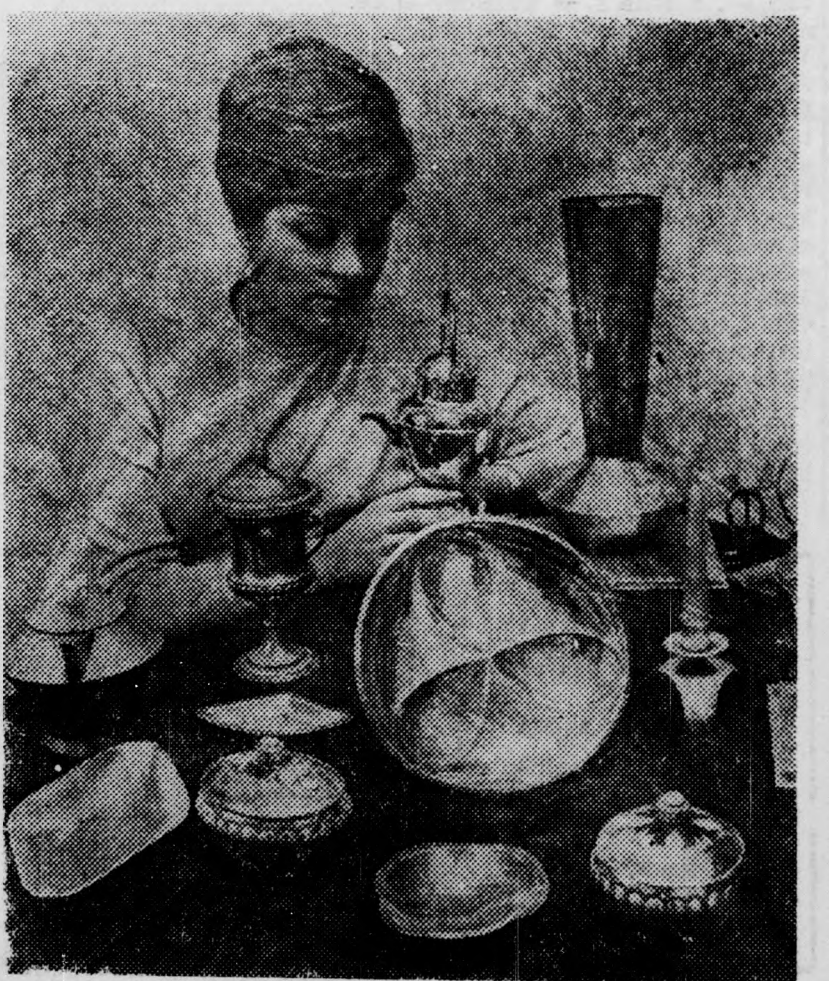
Egy kollektív, amelyet Angliában mutatnak majd be

manchesteri magyar szövetségi tagjai részvételével készültünk. Legújabb munkáinkból: a cizellált kerettel díszített női táskából mintát rendeltek Dániába.