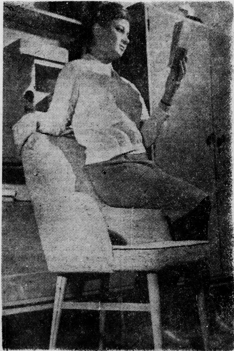
A Szék- és Kárpitosipari Vállalat debreceni üzemében új szék típus gyártását kezdik meg Bokréta néven. A következő két hónapban már 400 darab készül el és kerül forgalomba