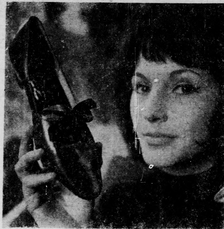
A Minőségi Cipőgyár új tavaszi, nyári divatújdonságai lényegesen eltérnek a jelenlegitől. A teljesen laposodó orr és vastag sarok jellemző a legújabb cipőkre. A színekben a fekete, a sötétbarna és a piros az uralkodó. Fekete cipő masni díszítéssel