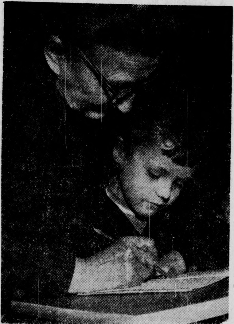
Igy ni... — A tanító néni segítségével formálódik az első „a” betű

Karcsló, barna, simahajú fiatal lány siet végig a város főutcáján. Kezében fontos, életet alakító okmányt szorongat: állami tanítónői ki-nevezését. Nagy öröm ez az apa nélkül maradt családban, egyvel kevesebb gyermekkel van gondja az édesanyának, egyvel több a kereset, könnyebb lesz a kis család élete. Mindez 1917. ja-