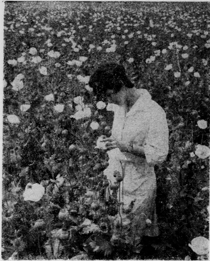
Virágzó mák. Ilyenkor is nélkülözhetetlenül fontos az ellenőrzés