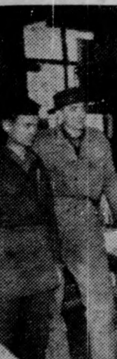
A járműjavító brigádjának versenyzői