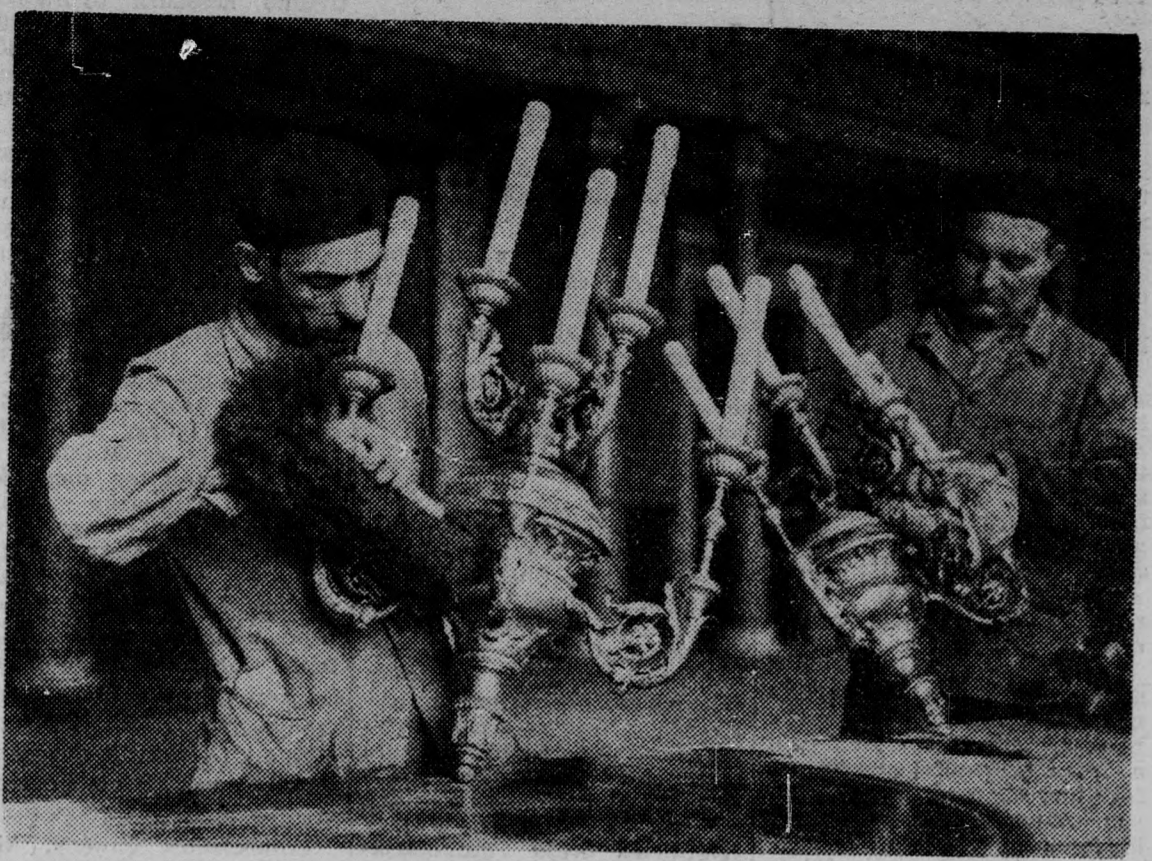
Évtizedenként kerül sor az Akadémia épületének alapos nagytakarítására. Az idén tavasszal a festők munkája nyomán megszüpültek a tervek, a folyosók és a lépcsőház, a hatalmas csillárokat és falikarokat megtisztították, megjavították az elkopott márványlépcsőket, s gyalulás után tükröfényesre lakkolták a parkettet. Megtisztítják a csillárokat és falikarokat