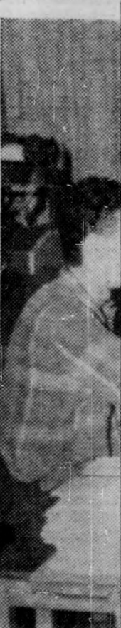
A debreceni brigád kezdte a szőlőművelést. Képünkön a brigád vezetője.

A Május 1. a Petőfi brigádja dolgozott a szőlőben.