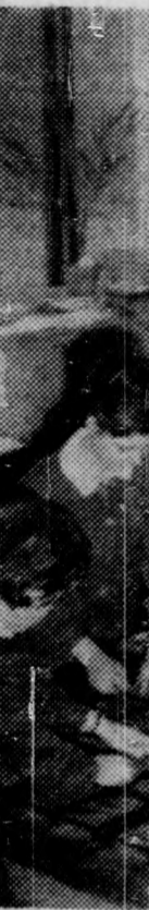
Március 13-án a debreceni AL

A vietnami seregre indított lombsólymák ki részüket dolgozók is. A vietnami seregre indított lombsólymák ki részüket dolgozók is.