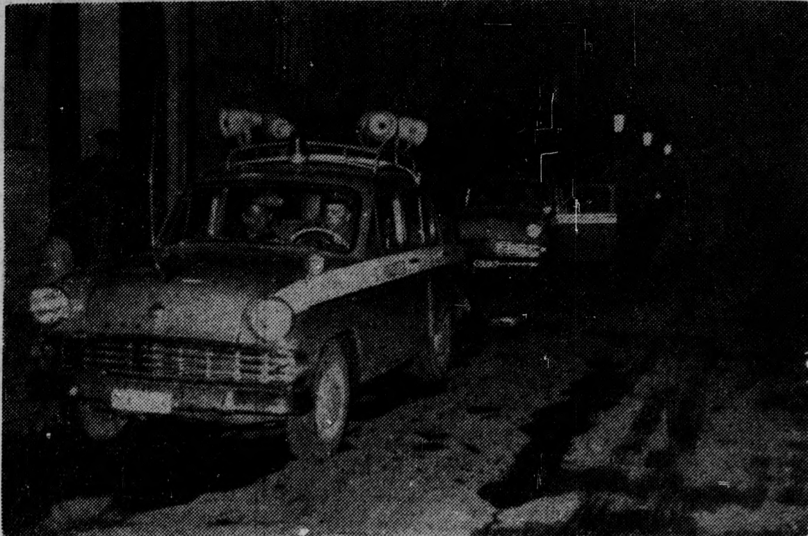
Megtörtént az eligazítás. Indulás előtt a közös ellenőrzés részvevői

EGY KÖZLEKEDÉSRENDÉSZETI ELLENÖRZÉS TAPASZTALATAIBÓL