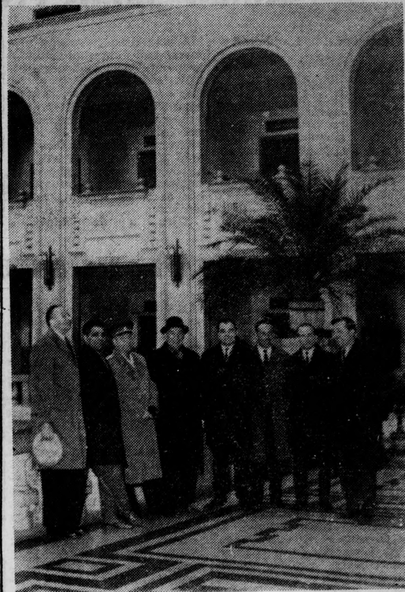
A küldöttség a Kossuth Lajos Tudományegyetem díszudvarán