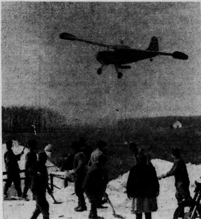
Hajdú-Bihar megye egész területén fokozott ütemben fejtrágyázzák az őszi vetéseket. A hajdúszoboszlói Vörös Hajnal Termelőszövetkezet őszi vetéséhez holdanként egy mázsa nitrogén és káli műtrágyakeveréket szórnak az egész nap dolgozó repülőgépek.