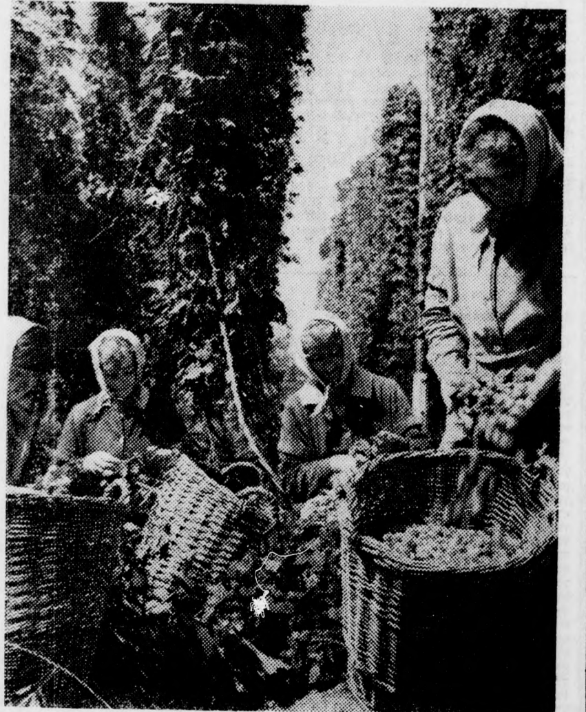
Az ország legnagyobb komlótermelő területe — 105 hold — az Újszilvási Állami Gazdaságban van. A korai cseh fajta betakarítását hamarosan befejezik, és rövidesen szedik az elzászi fajtát, amely holdanként 7—8 mázsa jó termést ígér