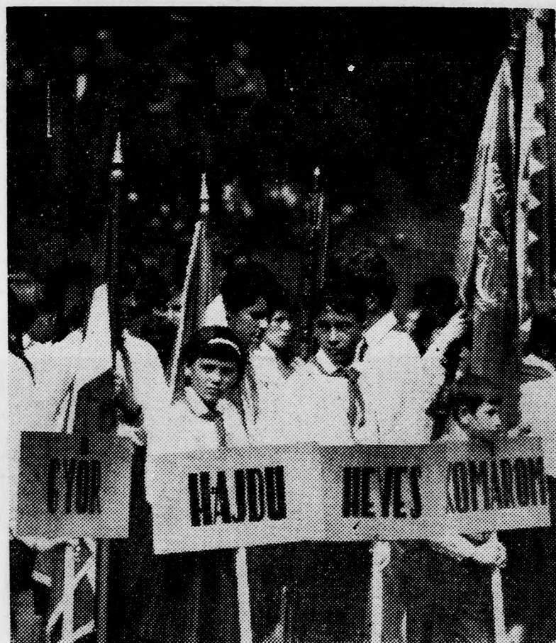
Több megye — köztük a hajdúságiak — küldöttei az ünnepségen

„A VÖRÖS ZÁSZLÓ HŐSEINEK ÚTJÁN” MOZGALOM