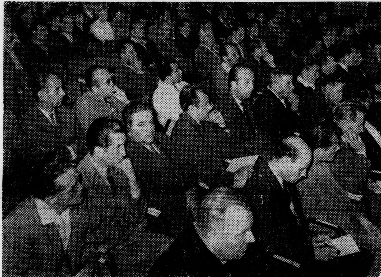
Az ünnepi megnyitón résztvevők egy csoportja

A harmadik ötéves terv ideje alatt — folytatta az OT elnökhelyettese — a mezőgazdasági termelést 13—14 százalékkal akarjuk növelni. Ennél nagyobb ütemű a nagyüzemek