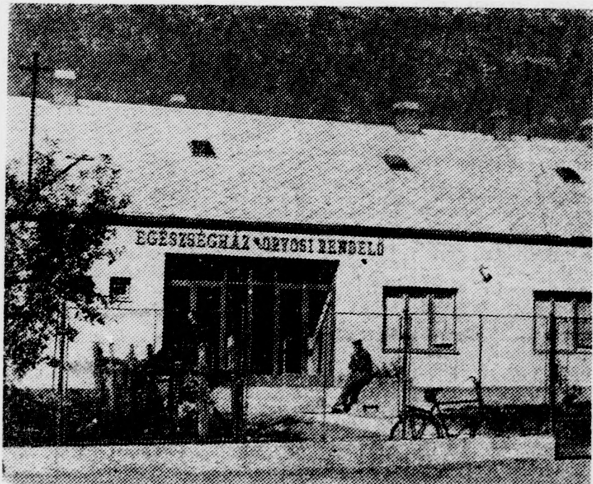
A nemrég felépült egészségháza naponta 30-40 beteg vizsgálják meg

Fülöp község utcáit járva feltűnt, hogy igen sok az új középület és lakóház. A művelődési otthon körül most is építők sűrűnek, a tanácsházat is tatarozzák. A tanács vezetői elmondották, hogy az utóbbi időben a háromezer lakosú községben megállás nélkül nagy ütemben folyik az építkezés. 1961-ben épült a művelődési otthon, ahhoz most toldalékként könyvtárat, klubszobát, büfét és más helyiségeket építenek. Az építkezés érdekessége, hogy a művelődési otthon új szárnya lesz az első emeletes épület a községben. Maidnem a kultúrház szomszédságában áll a nemrég épült egészségház. Orvosi rendelőjében naponta 30-40 beteget vizsgálják meg, és re-