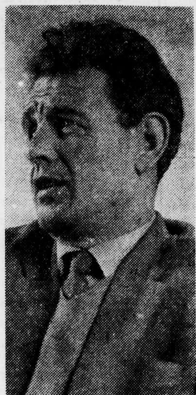
Mindig ugyanazokat az arcokat látom...

hogy a termelőszövetkezet korántsem volt szilárd, nem nyújtotta azt, amit a lakosság várt tőle. Munkafegyelmű, jóvellemi, gazdálkodási és társadalmi tulajdonú érintő gondok foglalkoztatták az embereket. Egy olyan községben, ahol a keresők 65 százaléka a falu egyetlen szövetkezetének tagja, ez a gazdasági probléma feltétlenül a községi közügyek iránti aktív érdeklődést csökkenti.