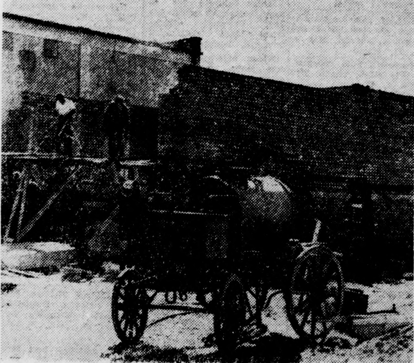
A művelődési otthon új szárnya lesz a község első emeletes épülete

A gyermekek okozta tüzesetek száma is állandóan nagy. A közelmúltban a debreceni Nagyerdőre mentek ki gyerekek, hogy cincért füstöljenek. A játszódozások közben az egyik tölgy kigyulladt. A tűzoltók eloltották a tüzet. Debrecenben a Borzán Gáspár utca 14. szám alatt eldobott cigarettavég okozott tüzet. Szerencsére idejében észrevették, s a helyszínre siető tűzoltók elejét vették a nagyobb veszedelemnek. A fent leírt esetek mind azt bizonyítják, hogy több gondossággal, figyelemmel elejét lehetne venni a tüzeseteknek. A figyelmetlenség igen sok esetben veszélyezteteti az emberi életet s az anyagi javakat. A tüzrendészeti utasítások megtartása mindenkinek egyéni érdeke, de kötelessége is.