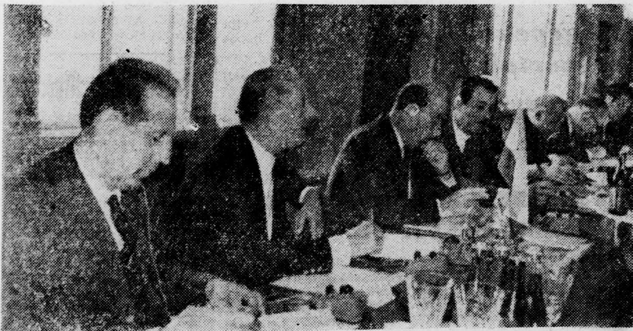
Moszkva: Gáspár Sándor, a Szakszervezetek Országos Tanácsának főtájtára (balról a második) a KGST tagállamok szakszervezetei képviselőinek értekezletén