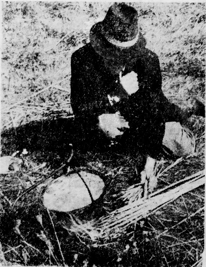
Fő a halászlé

azonnal el is takarítják. Ha pedig nagyobb mennyiségről van szó, a Vöröskereszt először megkeresi a felelőst, és felszólítja, hogy takarítsa el munkájának nyomait. Ahol ezt nem sikerül megtenni, ott sem hagyják a szemetet. Több vállalat ajánlotta máris, hogy gépkocsival segíti az akció sikerét — ezeket veszik igénybe.