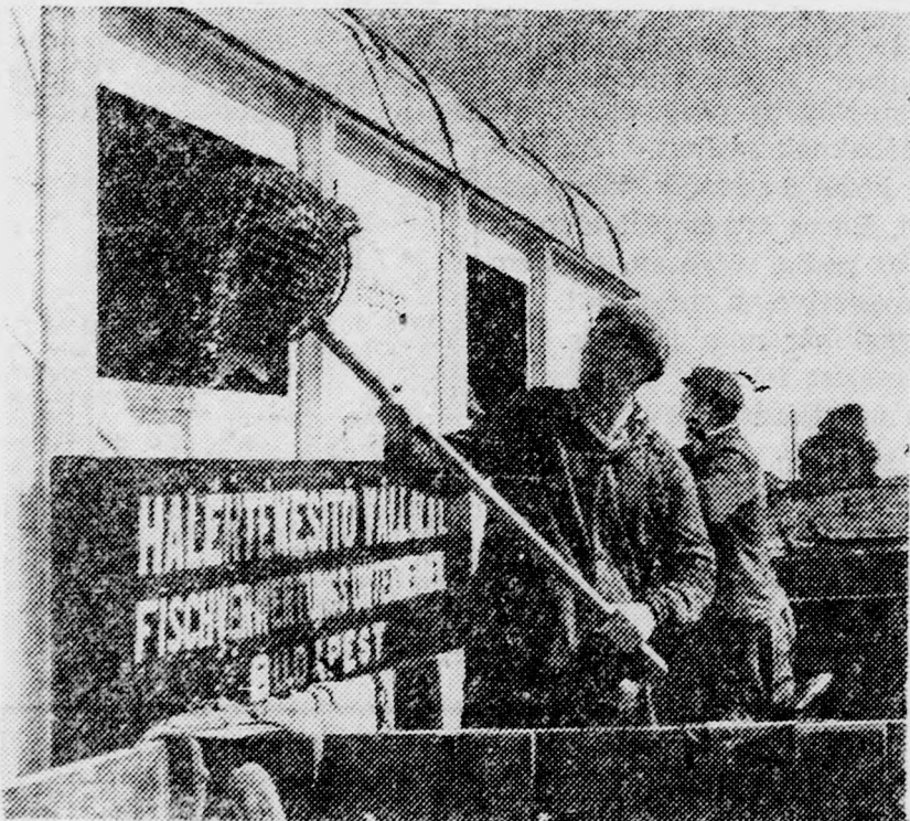
Hűtőkosziba rakják a halat és szállítják Budapestre

Nyárra fordult az idő. Huszonhat fokos melegben járunk a Hortobágyot. Más már ez a táj, mint volt gyermekkoromban, amikor csak a délibáb, a gulya és a szikes vonzotta a külföldieket és a hazai látogatókat. Onálló község lett Hortobágy. Állami gazdasága van, több ezer holdas halastóval. Iskola, orvosi rendelő, gyógyszerár épült a lakosság növekvő igényeinek kielégítésére. Ma is őrzi még e táj azonban a hajdani romantika egy részét. Miközben haladtunk Gyökérkút irányába, ahol megkezdődött a halastavakban a lehalászás, a csontkemény szikes utak mellett nád és sásrengeteg haladozott a forróságban. A különböző madarak vijjogása messzire elhallatszott. Zetorok, teherautók tűntek fel a napfényben.