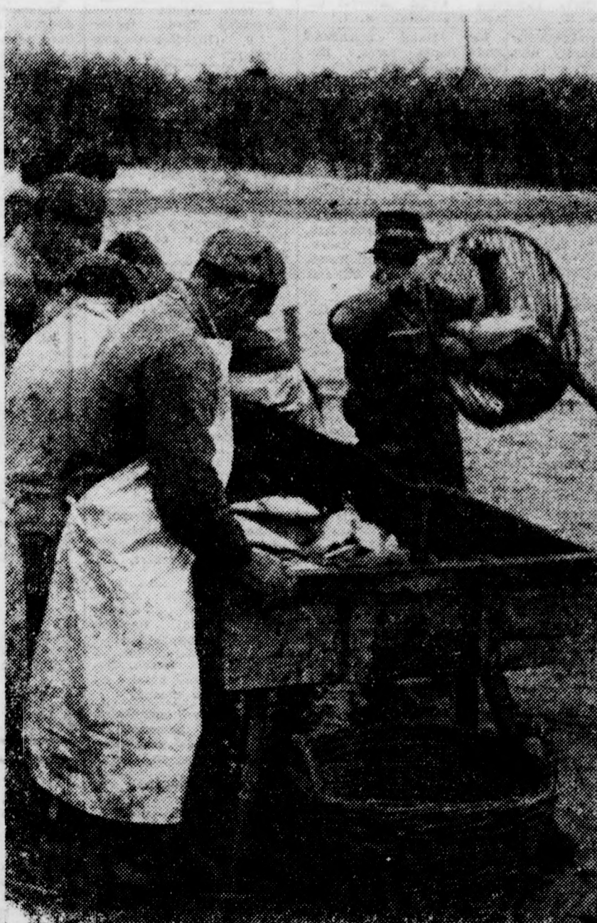
Nagyság és fajták szerint osztályozzák a halakat

A Bocskai Termelőszövetkezet halászati tevékenysége a