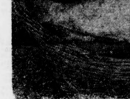
„Csendélet” a kosárban. Négy kilós ponty a kárászok és törpeharcsák között

szontalan növények, amelyek kitaraktása a halastavakból igen sok munkába és fáradságra kerülne. A most lehalászásra kerülő fehér amur különben egyelőre nem kerül sem a piacra, sem a szövetkezet halászcserdjébe, mert az egészét átadják a gyomai Viharsarok Halászati Szövetkezetnek, ahol főleg holtágakban még tovább tenyésztik. A szövetkezetnek különben van még egy későbbi telepítésű állománya, abból kerül majd a népszerű hajdúszoboszlói halászcserdjébe a fehér amurból is. Így a betérő vendégek hamarosan megköstölhatják az új hal húsát.