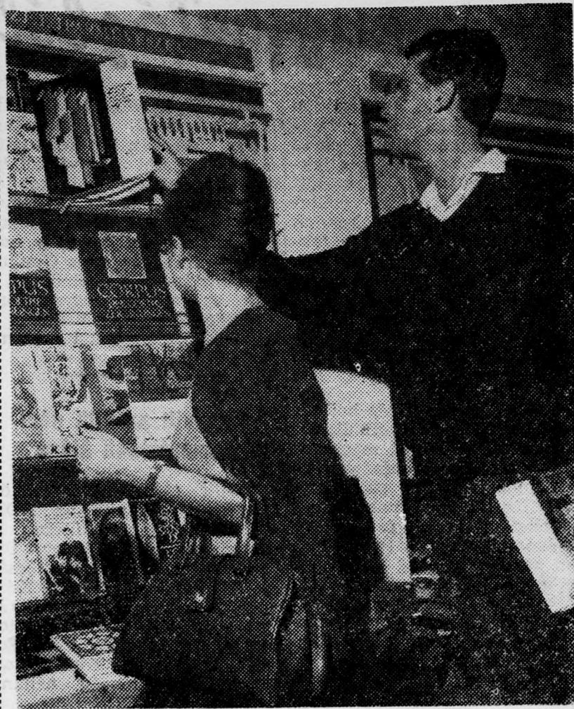
A Német Demokratikus Köztársaság megalakulásának 17. évfordulója alkalmából megnyílt gazdag anyagú könyvkiállítást állandóan sok érdeklődő keresi fel a budapesti Könyvklubban. Képünkön: a látogatók lapozgatják a szépen illusztrált köteteket