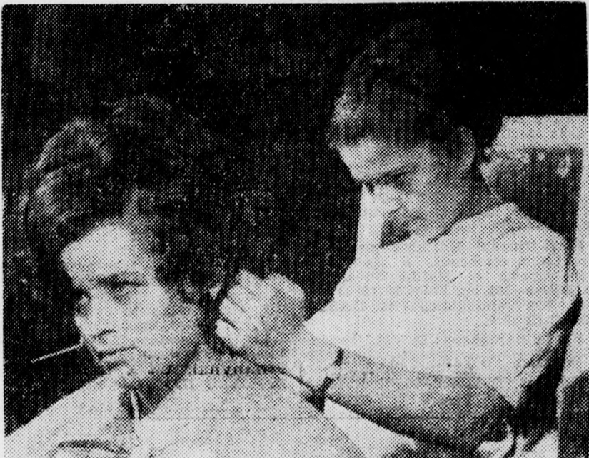
Készül a modern női frizúra a KIOSZ által rendezett fodrász-szakmai bemutaton

Hétfőn egész nap csaftogtak a fodrászok a KIOSZ megyei központjában. Ekkor rendezték meg a hagyományos fodrászbemutatót a megye fodrász kisiparosai részére. A debreceni szakosztály tagjai bemutatták a legújabb, legmo-