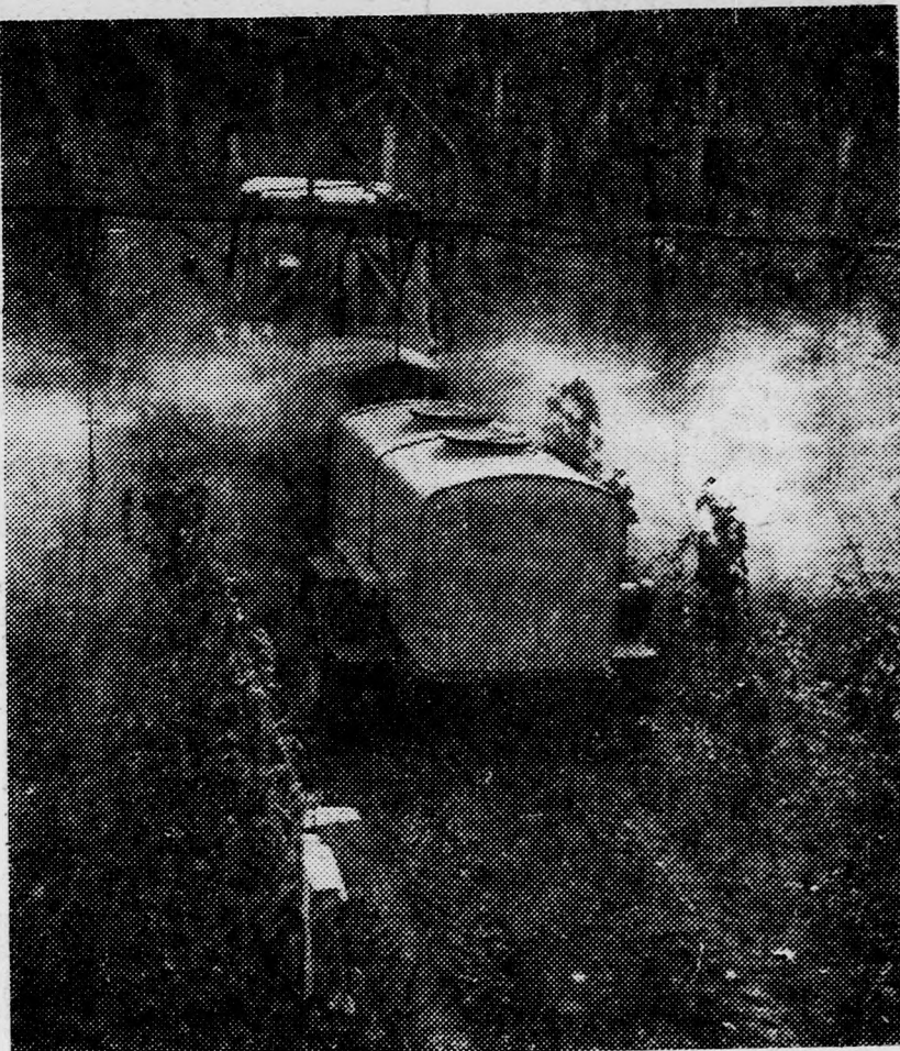
A kővágóörsi Kálvölgye Termelőszövetkezetben a megyei tanács, az AGROTRÓSZT és a gégyártó vállalatok bemutatják a hegyvidéki szőlőművelésre alkalmas mezőgazdasági gépeket. A képen: Rapidtox-Super permetezőgép, a Mezőgazdasági gépgyár debreceni üzemének terméke. (MTI Foto — Fehérvári Ferenc felv.)

120 kilométeres sebességgel haladhatnak a vonatok. Jövőre a Nyíregyháza-Záhony közötti vonalszakasz villamosítására kerül sor. (MTI)