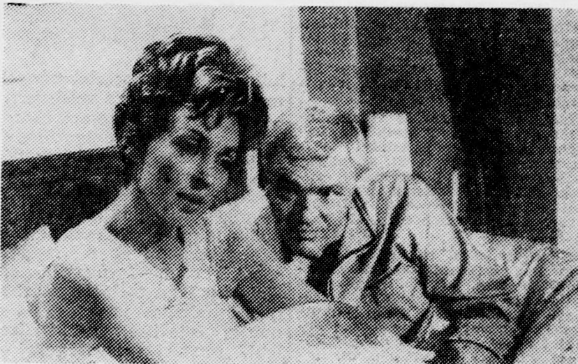
Jelenet Az állhatatos feleség című filmből

A debreceni Apolló mozi október 27-től november 2-ig tartja műsorán az Aranyáskány című színes, szélesvásznú új magyar filmet. Kosztolyáni Dezső azonos című regénye alapján készült.