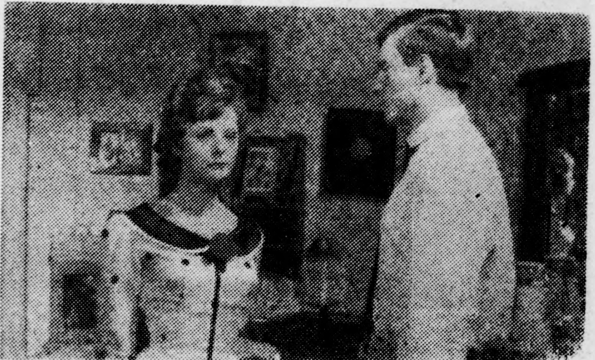
Jelenet az Aranyáskány című filmből

A Művész mozi október 27-től 29-ig a Drága John című svéd filmet mutatja be. A filmet Lars Magnus Lindgren rendezte.