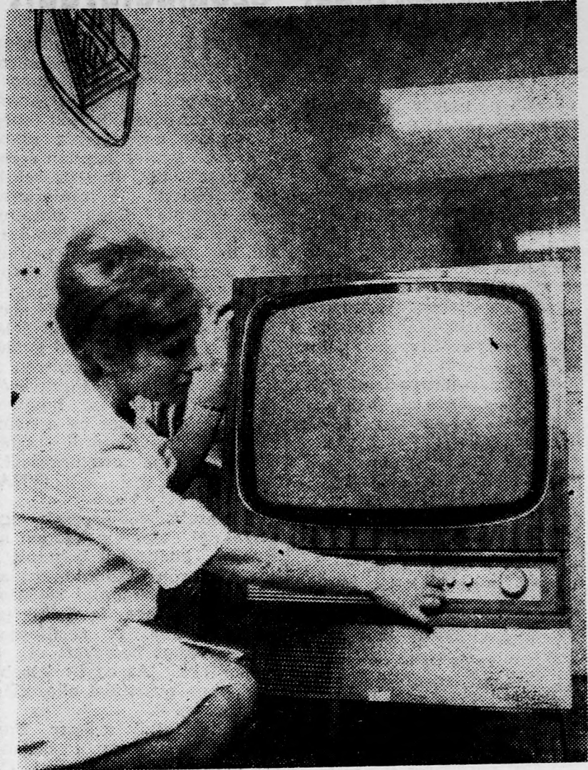
Új televízió, a Mona Lisa mintakészülékeit szerkesztették meg a szakemberek a Székesfehérvári Villamosági, Televízió és Rádiókészülékek Gyárában. Ugy tervezik, hogy ezt a típust a jövő év közepétől gyártják, s egyidejűleg beszüntetik a gyár Horizont típusú készülékeinek gyártását. A Mona Lisa kiváló képminőséggel, jó vételérzékenységgel rendelkezik, és csak lábon álló kivételben vásárolható majd.