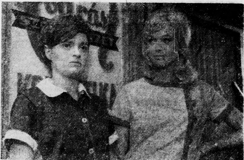
Nem szoktam hazudni című magyar film

A debreceni Víg mozi november 10-16-ig tartja műsorán a „Nem szoktam hazudni” című szélesvásznú új magyar filmet. A fiatalokról szóló, derűs hangú filmet Kárpáti György rendezte, a főbb szerepeket Voith Ági, Zolnay Zsuzsa, Mádi Szabó Gábor, Fülöp Zsigmond, Gobbi Hilda, Torday Teri alakítják. A játékfilmmel egy műsorban vetítik a Próbafelvételi című riportfilmet, derűs pillanatképeket a fiatal szereplők stúdióbeli kiválasztásáról.