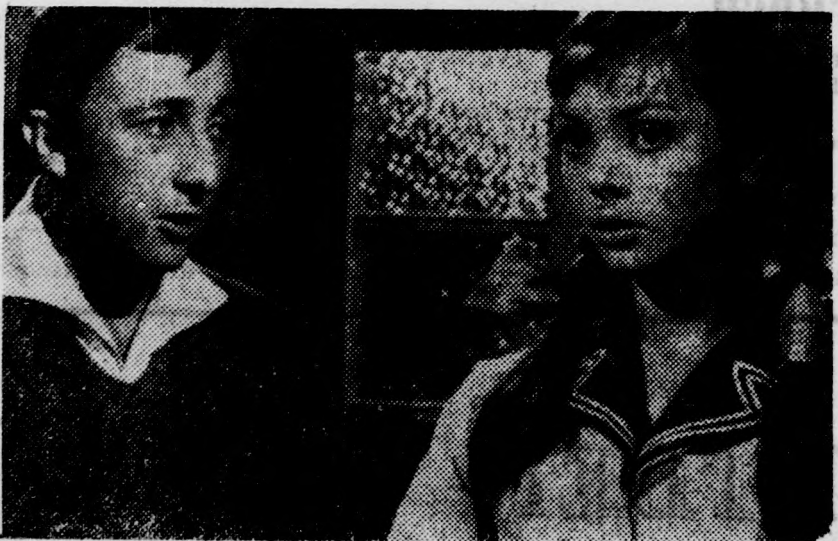
Jelenet a Kancsal szerencse című magyarul beszélő lengyel filmből

A Művész mozi november 10-11-ei műsora Petrovic: Találkozások. Fesztiválynertes jogszláv film a háború lélektani problémáiról. Kísérőműsor: „Egy könnyesepp az arcon” című jogszláv kisfilm. November 12-én magyar sportfilmek bemutatása: 6:3 (a londoni győzelem), A kerek labda nyomában, Ötusa. A jég művészei 1963. A filmek a magyar sportsikerek emlékeztető pillanatait elevenítik fel.