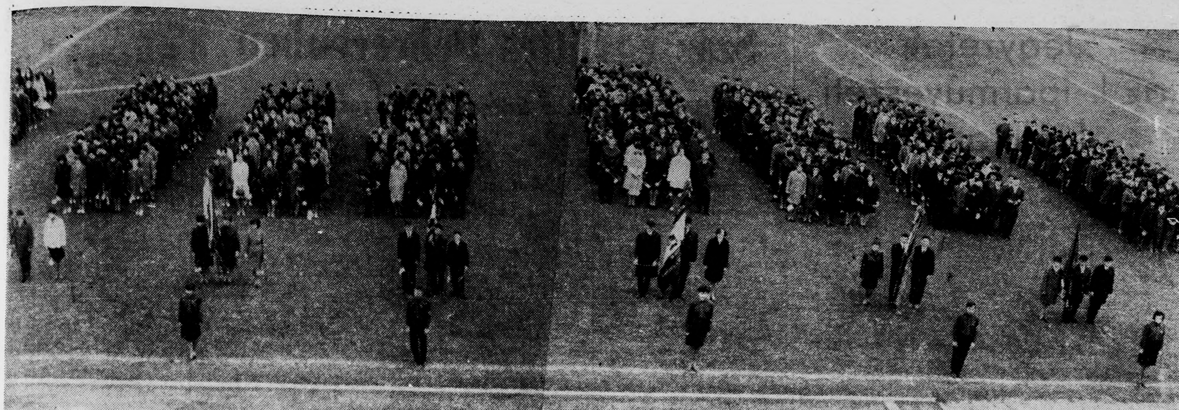
A fogalomtételre felsorakozott fiatalok a debreceni stadionban