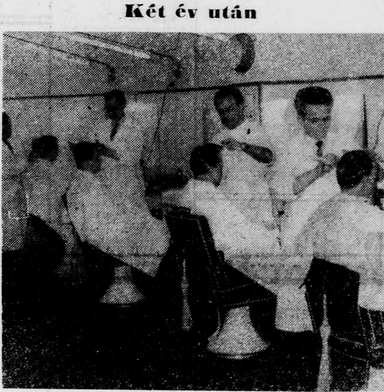
A Debreceni Fodrász Szövetkezet az elmúlt évben az üzletek felújítására, korszerűsítésére több mint 800 ezer forintot fordított. A napokban nyitotta meg a két évvel korábban a Kossuth utcán bezárt üzletét.