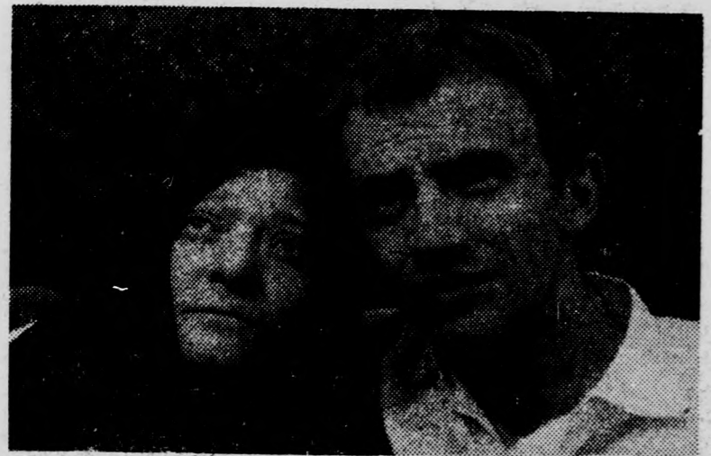
Jelenet a Hogy szaladnak a fák című magyar filmből

A Vig mozi április 6-tól 9-ig az „Alibi a vizen” című magyarul beszélő, szélesvásznú, csehszlovák filmet