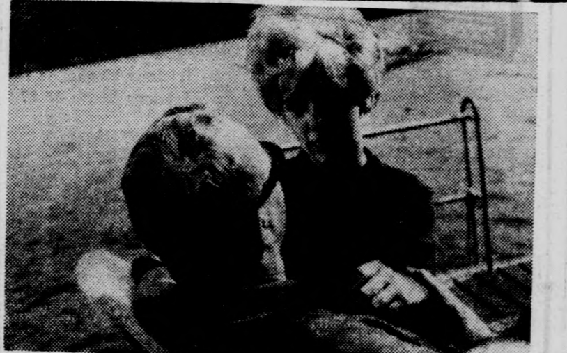
Az Alibi a vizen című csehszlovák film egyik jelenete