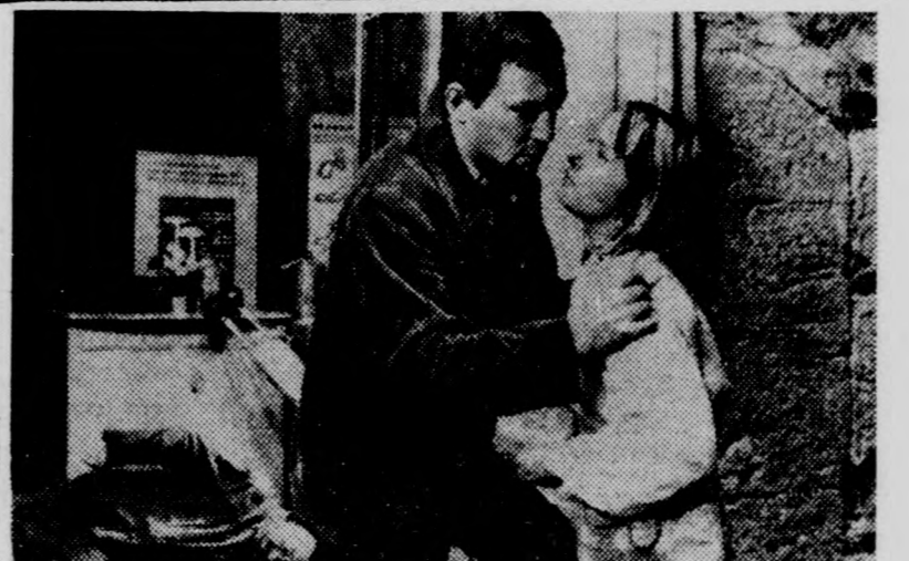
Egy jelenet az Út a tálso partra című francia filmből