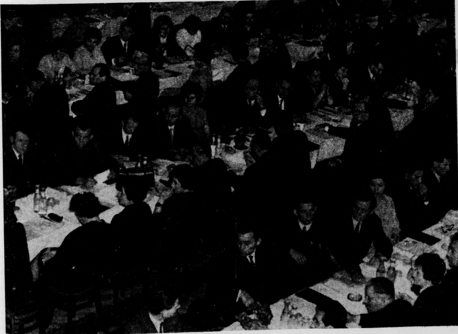
A küldöttek egy csoportja

Hajdú-Bihar NAPLÓ 3. oldal — 1967. április 8.