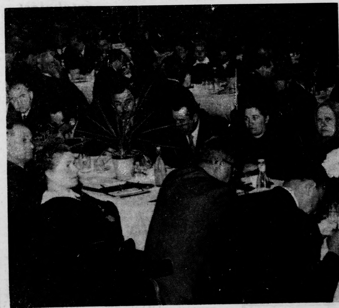
A tanácskozás résztvevői nek egy csoportja