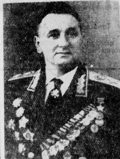
Grecsko marsall az új szovjet honvédelmi miniszter