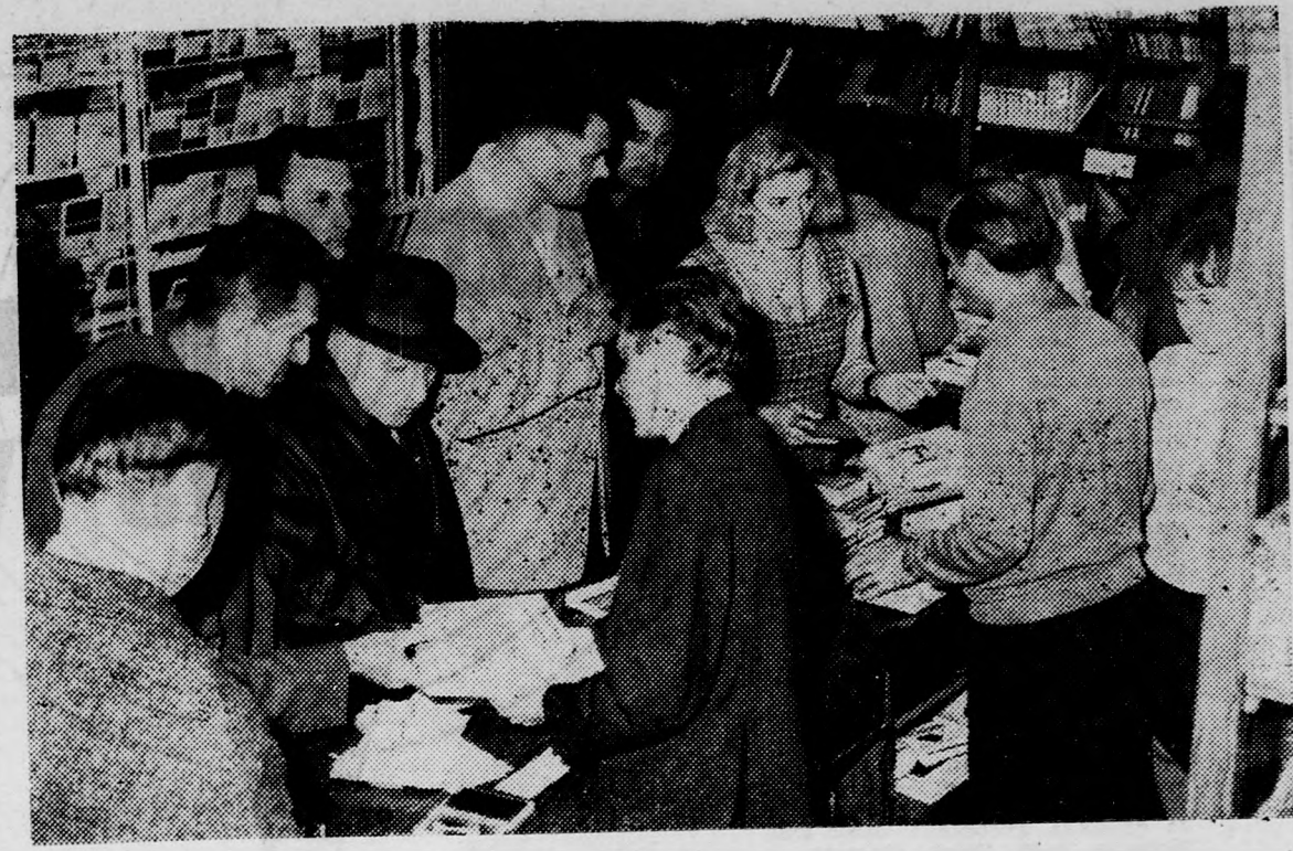
Nagy forgalom a Csokonai Könyvesboltban