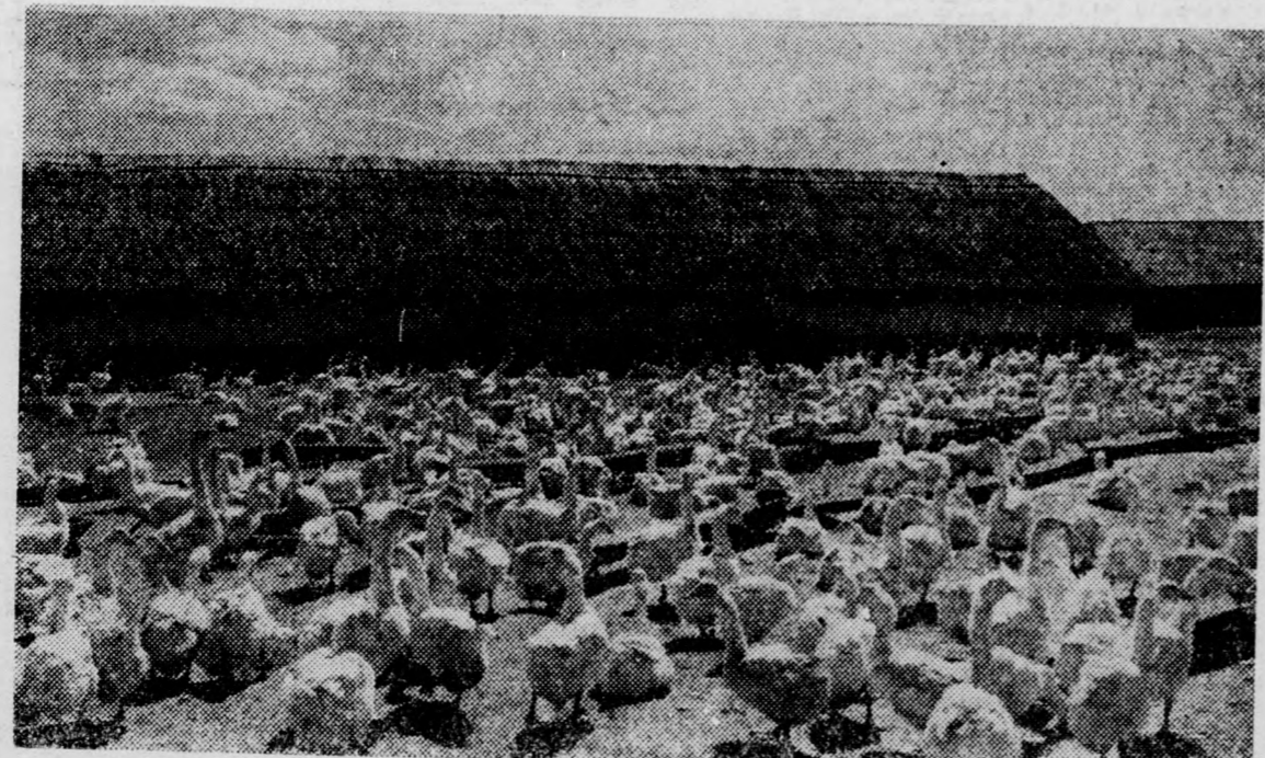
Ezer rajnai liba egy csomóban. Egy libától a múlt évben 700 forint volt a bevétel