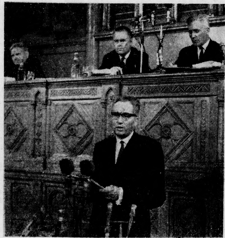
A kongresszuson felszólalt Fehér Lajos, az MSZMP Politikai Bizottságának tagja, miniszterelnök-helyettes