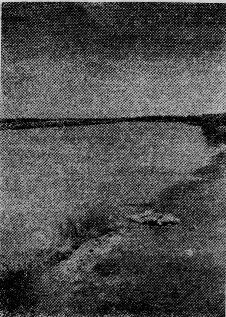
A megáradt Tisza. Ameddig a szem ellát, a két töltés között — az árterületen is — víz van

A Tisza gátja egy kilométernyire lehet a községtől, Tiszagyulaházától. S hat hete már, hogy a megáradt folyó vize nyaldossa, mossa a töltés oldalát. Hat hete vigyázzák már, hogy az egymást követő árulámok nehegy átszakítsák a gátat. Éppen a napokban — a negyedik árhullámmal — fogtak el egy buzgárt a község határában.