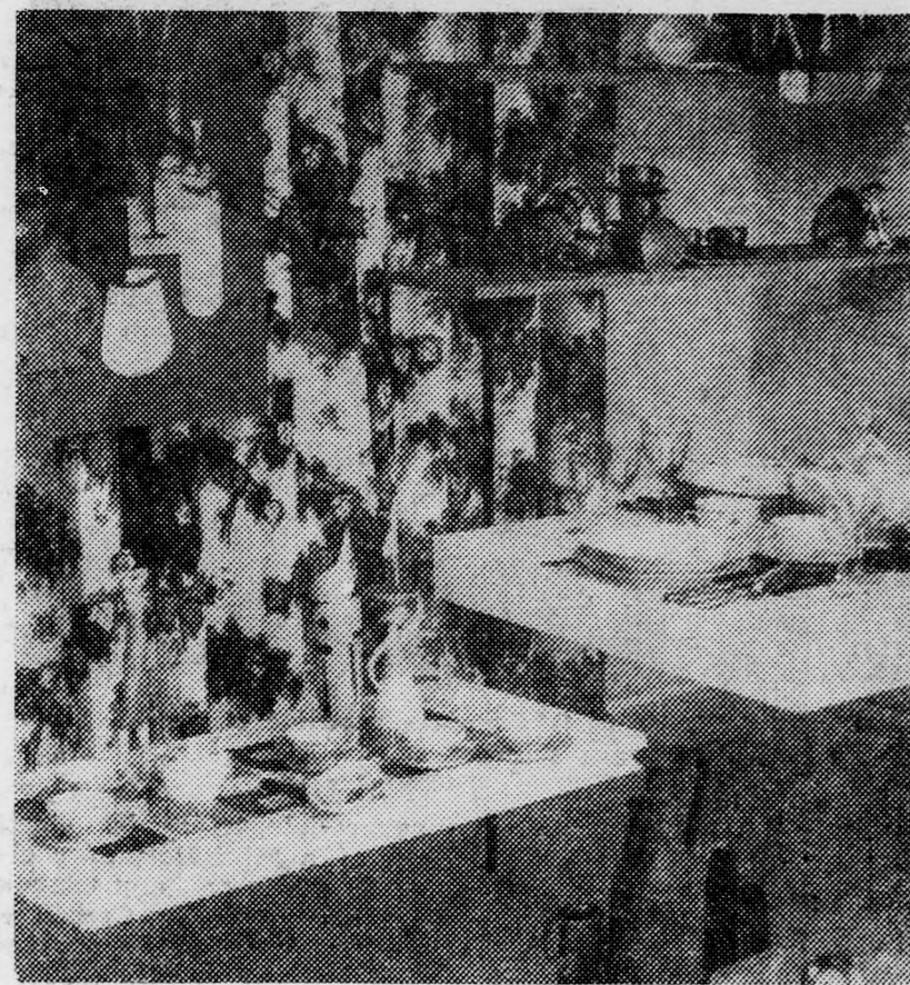
A Hajdú-Bihar megyei Vegyiparicik-kiskereskedelmi Vállalat 2. számú Üveg- és Porcelánboltja igen szép és változatos kirakattal kedveskedik a debreceni háziasszonyoknak. Útnaponként újabb és újabb kávé- és étkezéssel, evészközzel, poharakkal megterített két asztalkát láthatnak itt az érdeklődők, amelyek mutatják: így kell szépen, ízletesen megteríteni otthon a családnak, a vendégeknek