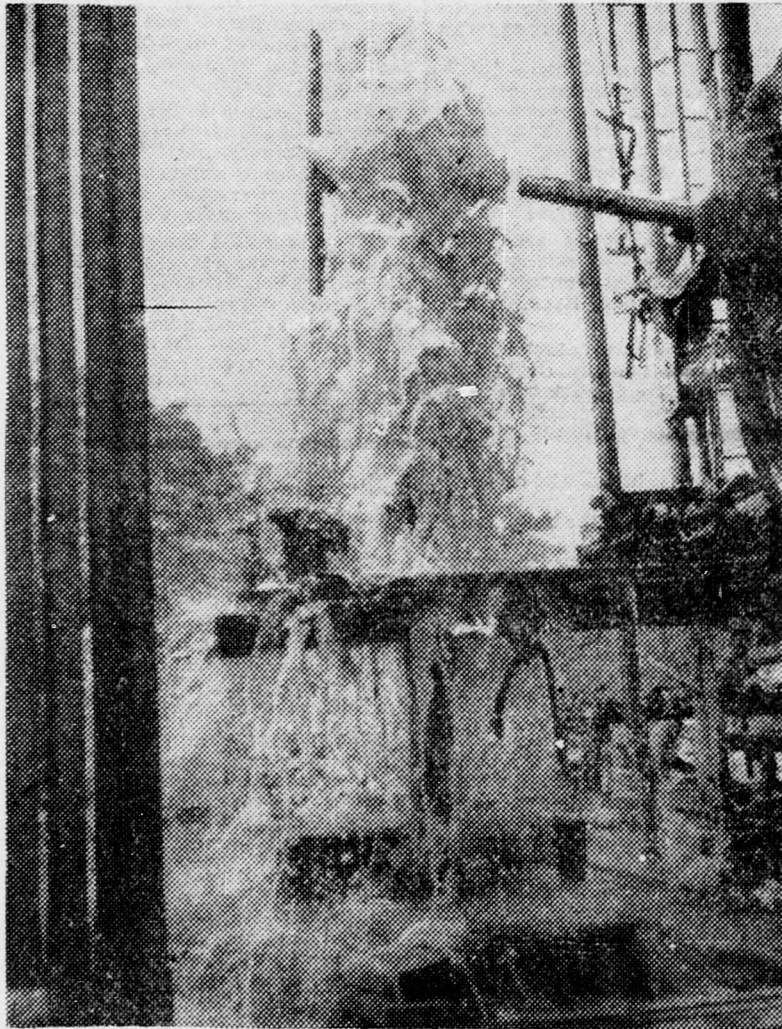
Feltört a víz!