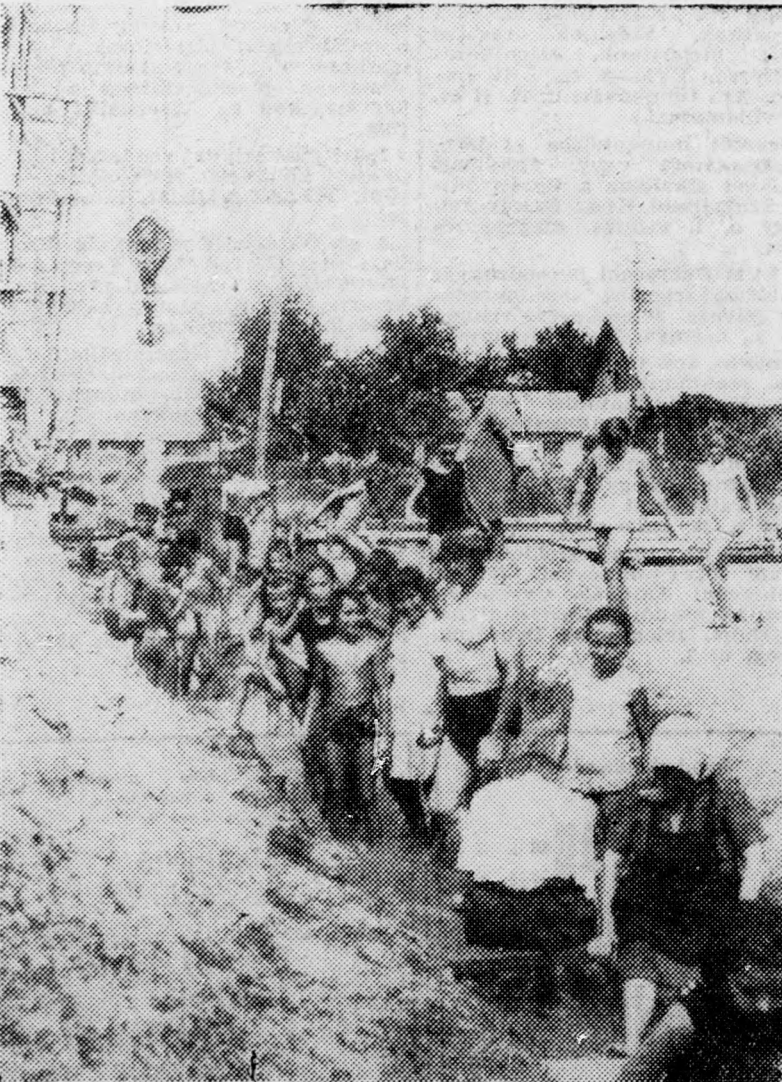
Az első fürdőzők