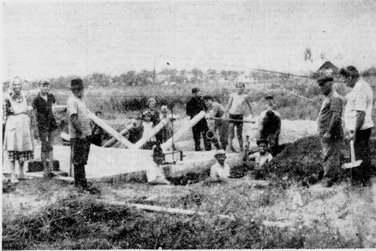
Társadalmi munka vasárnap