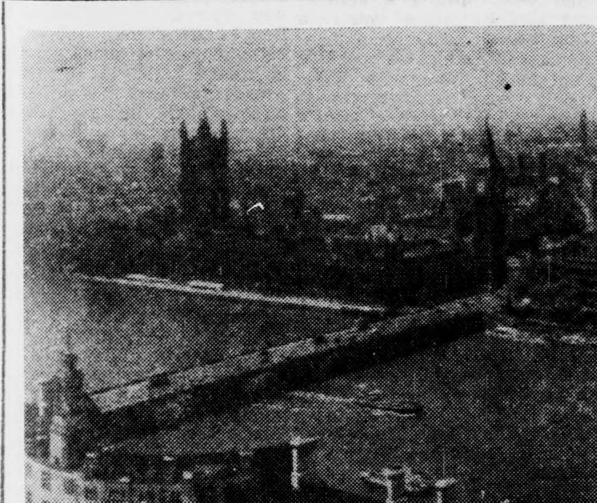
A Temze partján áll a parlament