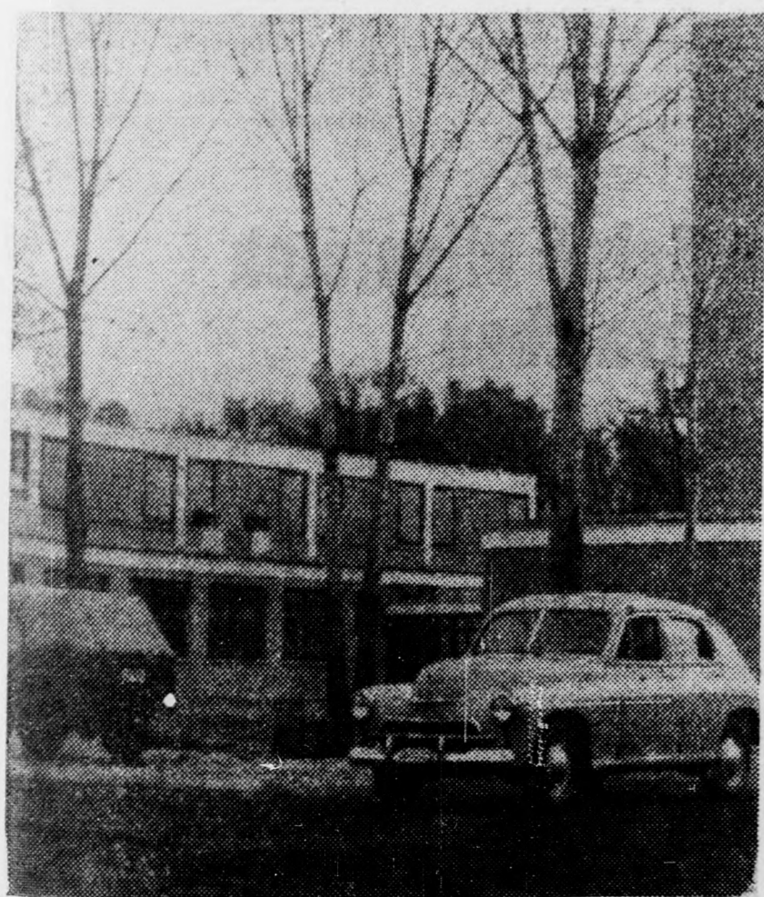
Az új gépjavitó üzem a debreceni Nagyerdőn

Debrecenben, a Kartács utcában elkészült a Hajdúsági Erdőgazdaság új gépjavitó műhelye, melyet az ÉVM Hajdú-Bihar megyei Állami Építőipari Vállalat dolgozói építettek. Az ötmillió forint értékű beruházással korszerű üzemet kapott a gazdaság, ahol a gépjavitási igényt már ki tudja elégíteni. Az új munkahely kényelmes, megfelelő körülményeket teremt a dolgozóknak, a műhelyt modern légfűtő berendezés fűti, az egész épületnek pedig központi fűtése lesz, amit a nagy teljesítményű kazánház biztosít. Az átadott létesítménnyel kapcsolatban a beruházó elégedettségét fejezte ki.