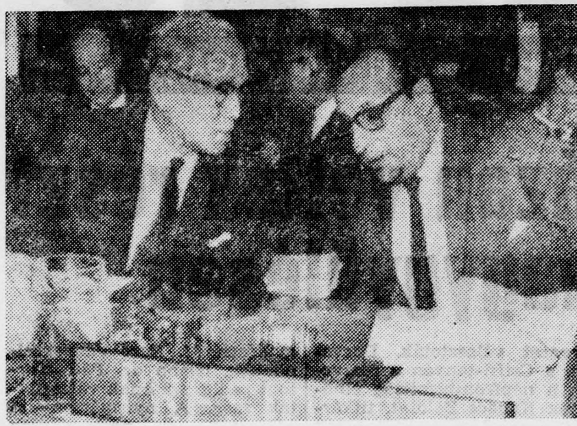
U Thant ENSZ-főtájtár (balról) a pakisztáni Agha Sahival, a Biztonsági Tanács elnökével beszélget a Pueblo-ügyben összehívott ülésen

A Biztonsági Tanács ülését bizonytalan időre elhalasztották. Az amerikai küldöttség minden erőfeszítése ellenére sem tudta biztosítani, hogy az állítólagos „koreai konfliktus kérdését” a tanács az Egyesült Államok által kívánt módon rendezze. A tanács tagjainak jelentős része vonakodik bármiféle olyan lépést tenni, ami sértené a KNDK szuverenitását, annál is inkább, mert a KNDK által előterjesztett bizonyítékok meggyőzően mutatják, hogy az amerikai kémhajó megsértette az ország területi vizeit és az ország két részét elválasztó vonalon, kiaknált helyzetet mindenképpen az Egyesült Államok felelős. Egvelőre nem ismeretes, mikorra hívják össze a tanácsot.