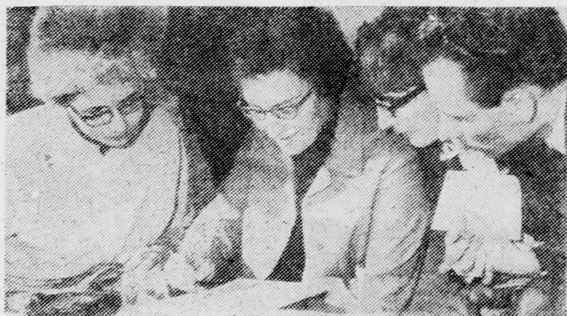
Gondban a zsűri

Alaposan megizzadtak vasárnap délelőtt, amikor számot adtak felkészültségükről, fantáziájukról, íráskészségükről, jártasságukról a kül- és belpolitikai eseményekben. Egyebek között riportot kellett írniuk egy képzeletbeli rakétaindításról, egy megadott képhez frappáns szöveget írni. Kiderült az is, mennyire kísérték figyelm-