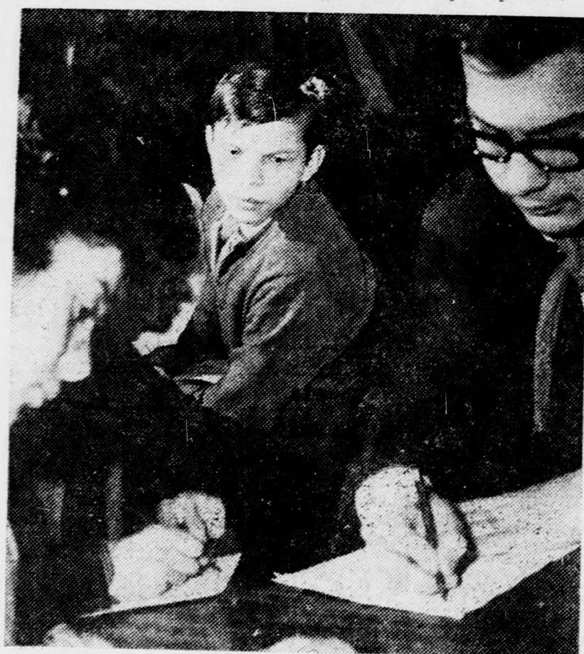
A téma a szomszéd asztalon hever

mel a múlt hét politikai eseményeit. A versengés után 12 pájtás került a döntőbe, ahol — a jövő vasárnap — már nehezebb feladatokkal kell megbirkózniuk. A győztes megkapja „Debrecen ifjú riportere” cí-