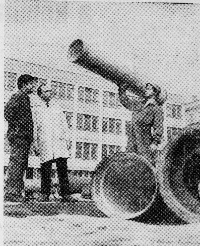
A csatornaépítési célokra alkalmas üvegszálerepítésű műanyagcsövek típusainak elkészítése igen jelentős. A mintapéldányok 50-szer kisebb súlyúak, mint az eddigi általánosan alkalmazott betoncsövek. A két méter hosszú csövet egy ember fél kézzel tudja felemelni, ennek következtében a csövek szállítása és beépítése jóval egyszerűbb. A csövek anyaga a szennyvizek kémiai hatásainak jól ellenáll, egymáshoz kapcsolásuk a gumiból készült tömítőgyűrűvel néhány mozdulattal megoldható.