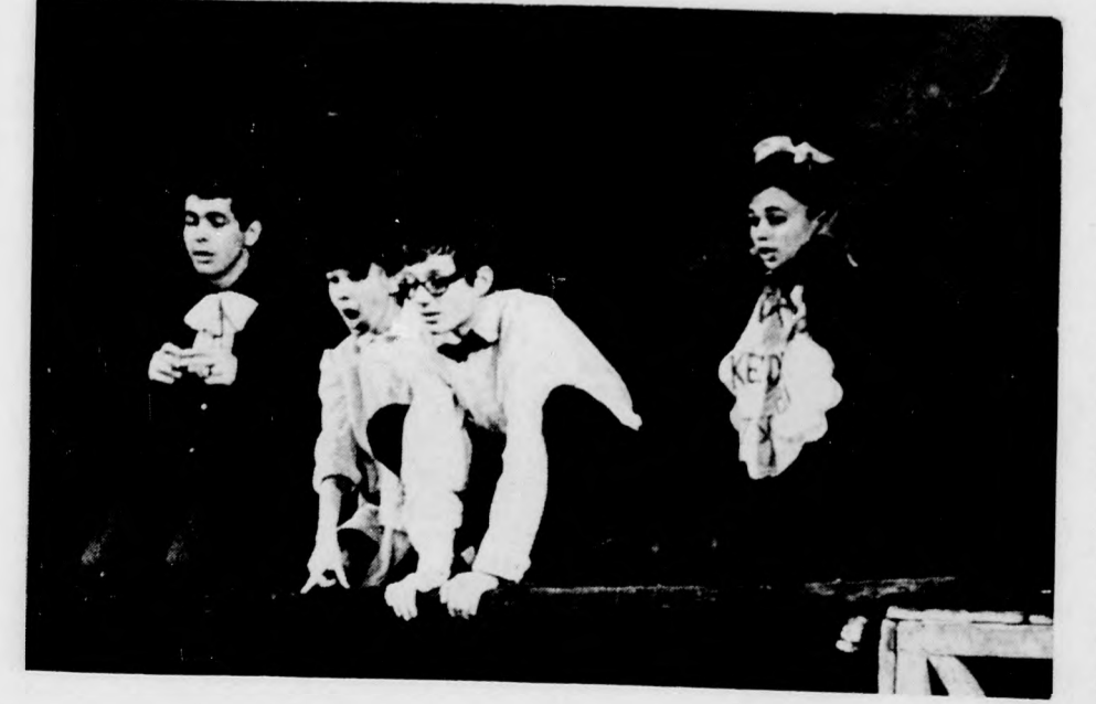
Micimackó, Malacka, Nyuszi és Zsebibaba az előadás egyik jelenetében