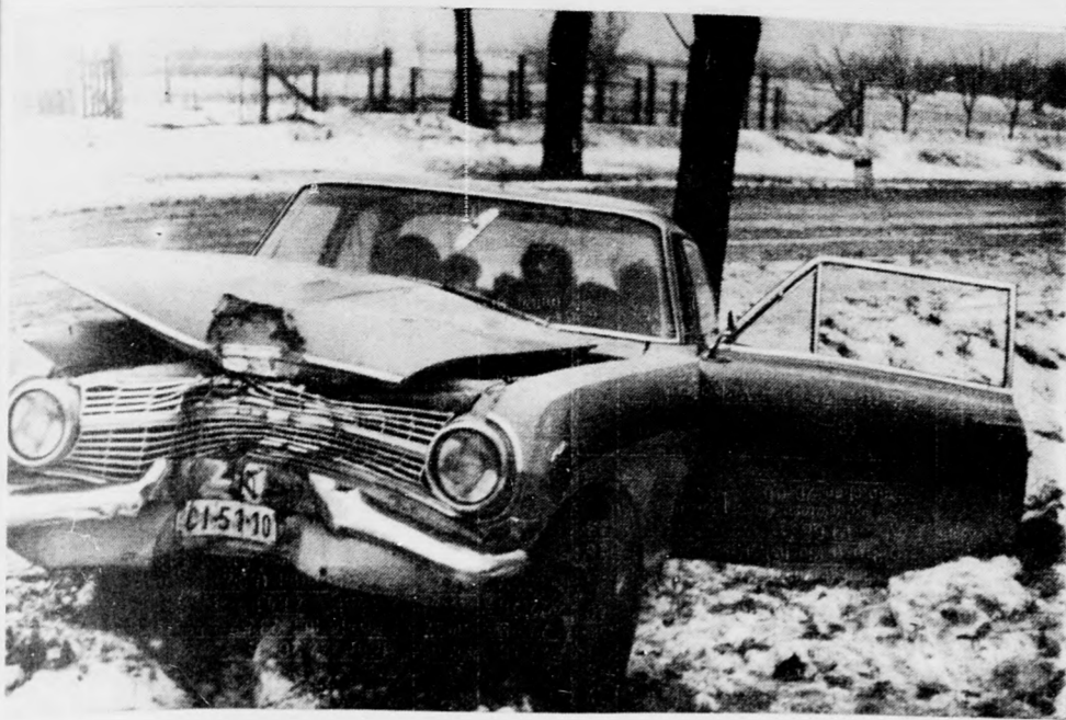
Gyorsan hajtott a csúszós úttelen

Az elmúlt hét folyamán hat közlekedési baleset történt a megyében, melyek közül kettő személyi sérüléssel végződött, míg négy baleset alkalmával csak anyagi kár keletkezett. A balesetek okai között a gyorsajtás mellett előfordult ok a szabálytalan előzés, szabálytalan kanyarodás és a gondatlan vezetés.