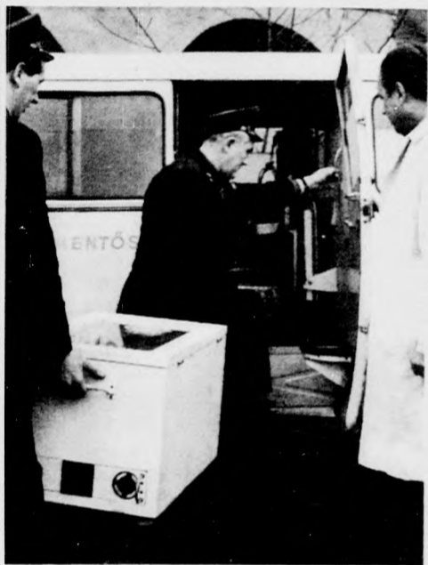
Útnak indul az életmentő „láda”