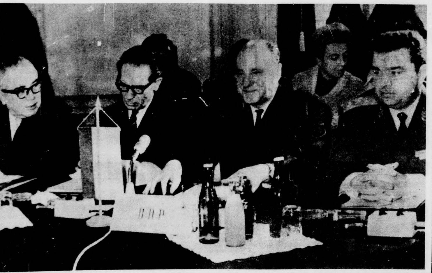
A magyar küldöttség a Varsói Szerződés Politikai Tanácskozó Testületének szófiai ülésén: Kádár János, az MSZMP Központi Bizottságának első titkára, Fock Jenő miniszterelnök, Péter János külügyminiszter, Czinege Lajos honvédelmi miniszter