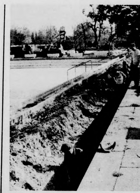
Föld alá kerülnek a strandon az új csatornák

A zalai termelőszövetkezeti vezetők csütörtökön a nádudvari Vörös Csillag Termelőszövetkezeten tesznek látogatást.