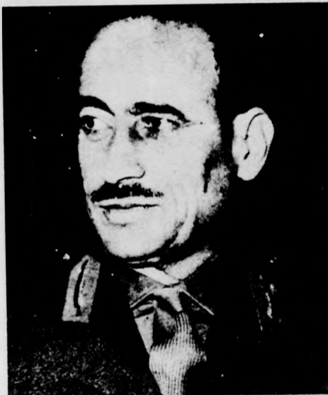
Aref volt iraki elnök szerdán délután egy iraki repülőgéppel megérkezett Isztambulba. A volt elnököt három iraki személyiség kísérte. Aref nem nyilatkozott az újságíróknak.

Arab kérdésekké foglalkozó izraeli szakértők véleménye szerint a bagdadi államcsinyt a Baath-párt jobbszárnya szervezte, a párt és jobboldali frakciójához közelálló elemek támogatásával. Az izraeliek — írja az AFP — elsősorban az a kérdés foglalkoztatja, milyen hatással lesz a puccs a Jordániában tartózkodó iraki csapatok magatartására. Mint Tel Avivban mondják, nem valószínű, hogy Irak, amely az Izraellel szemben legellenségesebb magatartást tanúsító arab országok közé tartozik, változtatson ezen a politikáján. Lehetséges azonban, hogy az ország belső problémái által elfoglalt iraki hadsereg talán kevésbé aktív támogatást nyújt majd a palesztinai