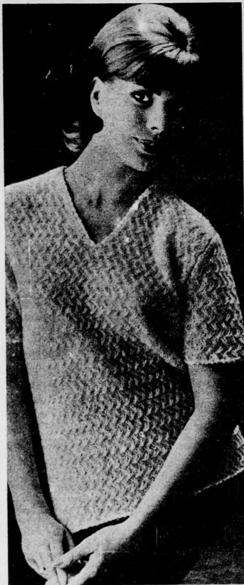
Körülbelül 30 deka zefirfonal kettős szálával, 3-as kötötűvel kötjük.

1. sor: 2 fordított után beöltünk a következő szembe, mintha fordítottan kötnénk, de a szálát elől elvezetjük. 2. fordítottól ismétlés. (Helyes, ha a szemeket úgy osztjuk be, hogy a sor végén 2 szel-szem előtt 2 fordított marad.)