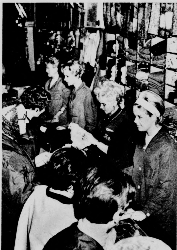
És egy második helyezett: a 10-es bolt eladói és vásárlói