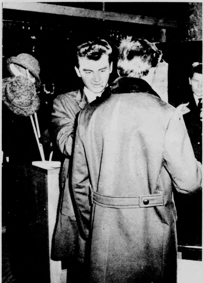
Az egyik első helyezett: a Csapó utcai férfiruhából (12-es) dolgozója — munka közben

jutalmat: a polgári 71-es és a debreceni 12-es (Csapó utcai) bolt kollektívája teljesítette legjobban a verseny feltételeit. Három második helyen a 10-es, 17-es és 18-as debreceni boltok végeztek, míg a harmadik helyre a 15-ös cipőbolt és a 4-es Elegancia dolgozói kerültek.