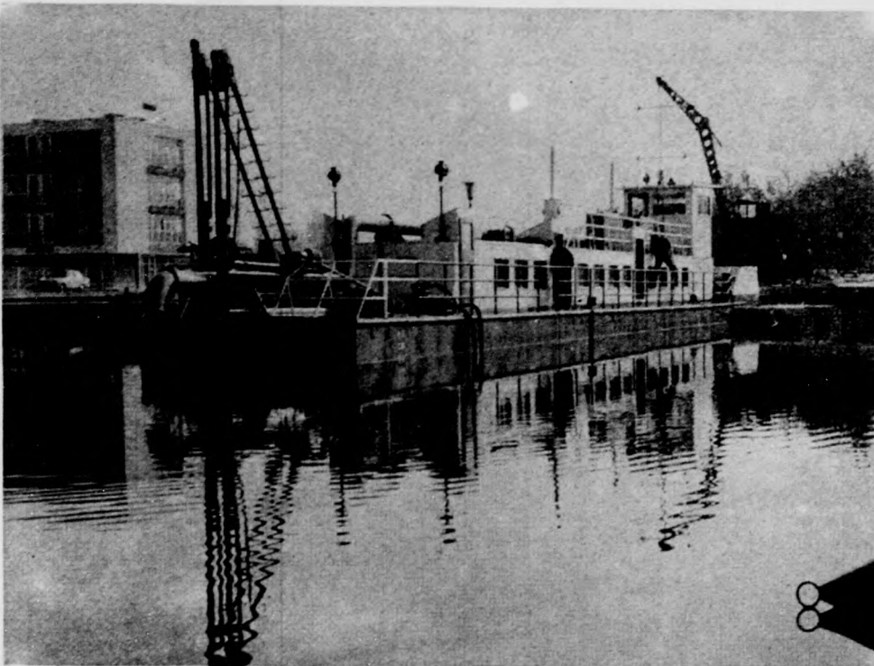
A Velencei tó meder- és partszabályozásához nagy teljesítményű névadó és iszapkotró berendezést építettek, amely óránként 40–60 köbméter iszapot tudja megszabadítani a tó medrét. Képünkön: Munkára készen áll az agárdi strandon a kotrógép monsterrum