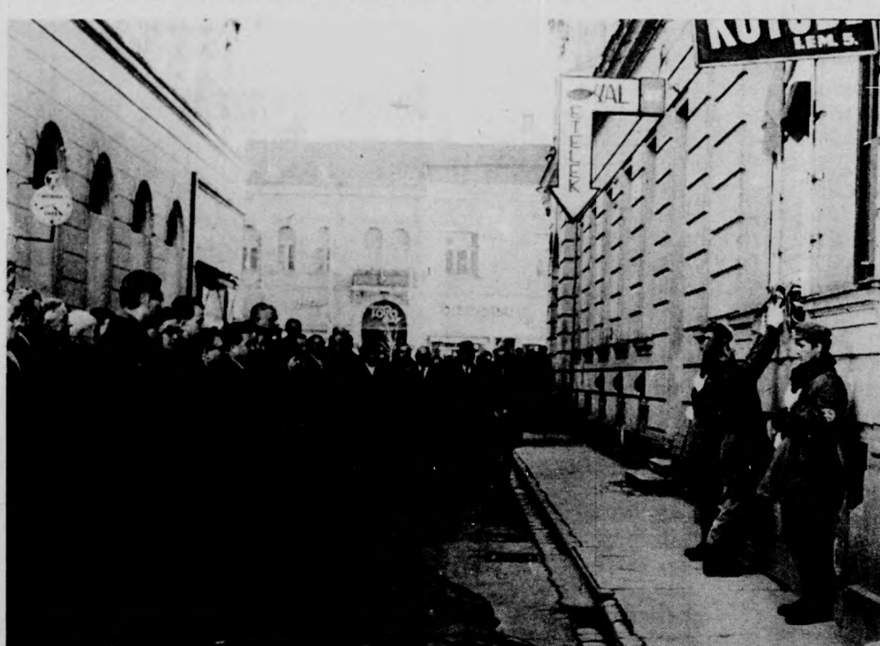
A hála és a kegyelet koszorúját helyezik el az emléktáblánál

Debrecenben alakult meg 1944 őszén az ideiglenes nemzetgyűlés és a nemzeti kormány, itt hozta meg első nagy jelentőségű törvényeit.