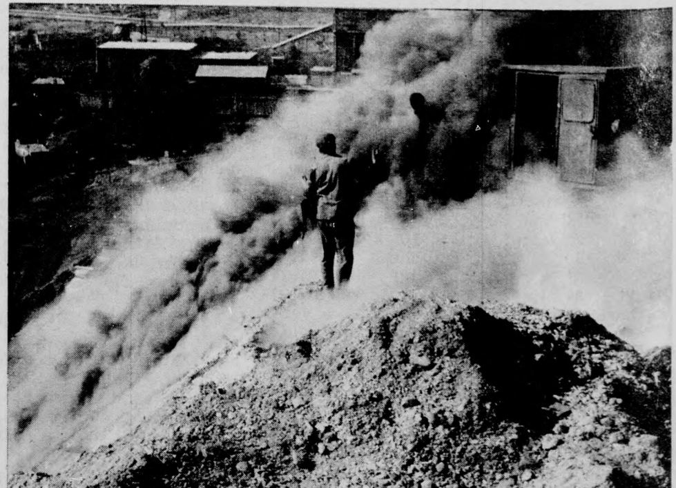
A Pécsi Hőerőmű kazánjait úgy tervezték, hogy alacsony fűtőértékű, gyenge minőségű szeneket lehessen égetni bennük. Az elektromos energiát közepes minőségű szén, iszapszén, szenes meddő és évtizedek alatt felgyülemlett hulladékszenek kalóriájából nyerik.

VARRÓNÓKET, FŰTŐT ÉS SEGÉDMUNKÁST FELVESZ A BŐRIPARI KTSZ. DEBRECEN, HATVAN UTCA 55.