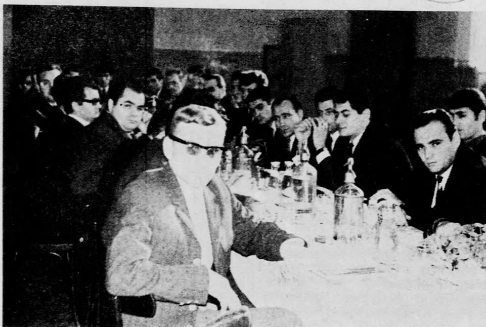
A küldöttértekezlet egy csoportja

A napokban tíz KISZ-alapszervezet hatvan küldötte jelent meg a MÁV Debreceni Járműjavító Üzem KISZ-küldöttértekezletén, hogy meghallgassa a vezetőség beszámolóját és megválassza az új vezetőséget — írja tudósítónk, Volosi-