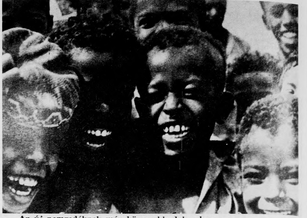
Az új nemzedéknek már könnyebb dolga lesz...

Az iskolai oktatás eltér az európaítól, eltér a miénktől. Az elemi iskolának megfelel az úgynevezett primary school, ami hat évig tart. Ez kötelező minden