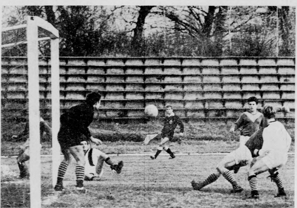
Az „északi” kapunál támad a fehér mezű DEAC.

A labdarúgó NB III-ban a DEAC bajnoksápa egygólos vereséget mért a D. Elektromosra, s a fősoklások négy pont előnnyel szereztek meg a bajnoki címet, miután a Hajdú Vasas Tégláson pontot vesztett Tuzsárral szemben. A kiesés körül az utolsó forduló döntött. Az már az elmúlt heten biztos volt, hogy Törökszentmiklóss mellett a D. Kinizsi a második kieső, de hogy melyik a harmadik, az csak vasárnap dőlt el. A DASE ellenlébasai, a Szolnoki Kilián és Nagykovács hajdú-bihari csapatok ellen győztek, s így megelőzték a fősoklásokat. (A csapatot csak az mentette volna meg, ha a kilenc NB III-as csoportban benne lett volna a két legjobb 14. helyezett közt.)