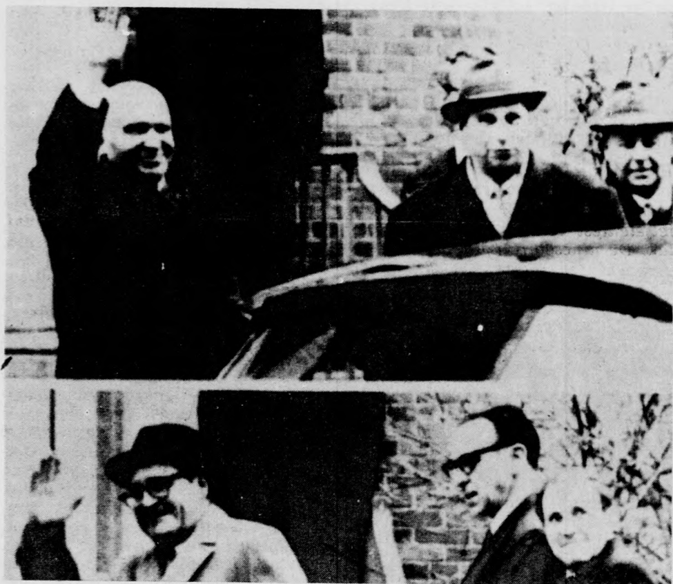
Második hete folynak a tárgyalások Helsinkiben, a stratégiai atomfegyverek korlátozásáról a Szovjetunió és az Egyesült Államok között. Felső képképen: (baloldalt) Szejmonov, a szovjet küldöttség vezetője, és a delegáció több más tagja, alsó képképen: (baloldalt) Gerard C. Smith, az USA küldöttségének vezetője, munkatársaival. (Napló-telefó — AP—MTI—KS)

Az elnökség tagjai egyhangúlag jóváhagyták az atomsorompó-szerződés ratifikálásáról szóló rendeletet, majd Nyikolaj Podgornij aláírta a rendeletet és a ratifikációs okmány három példányát.