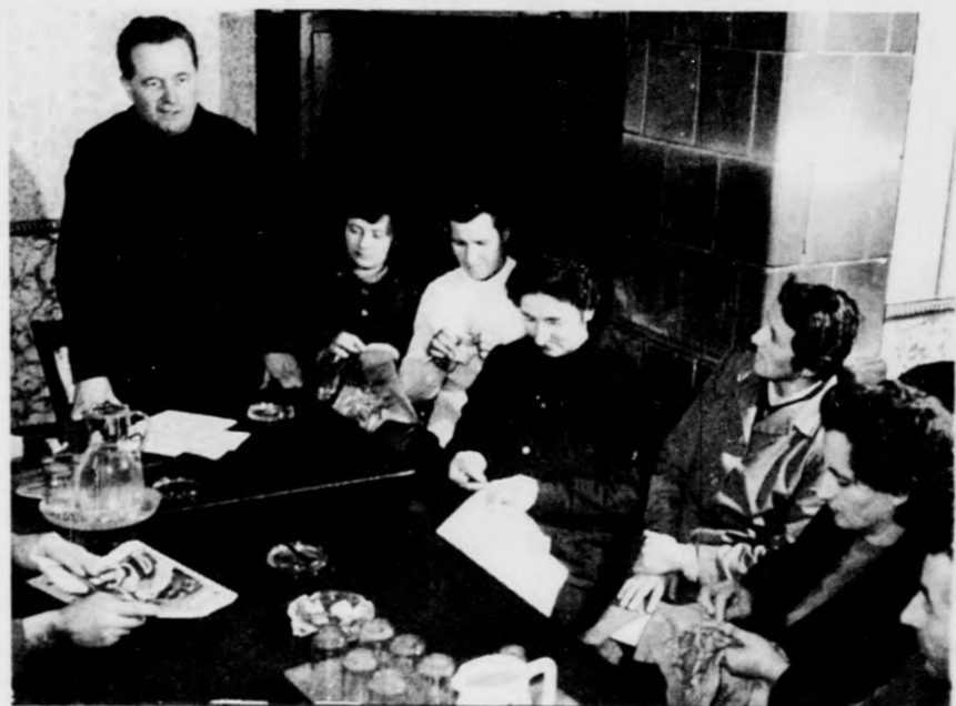
Kézimunkázva a tanfolyam is könnyebb

„A termelőszövetkezetbe visz-szajönnék.”