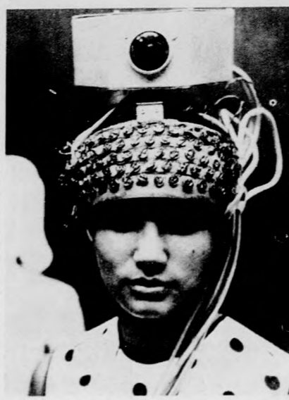
A lengyel orvosi akadémia szemklinikáján előállították az „elektroftalm” nevű berendezést, a vak emberek „vezetőjét”. Az „elektroftalm” lényege, hogy a vak fejére fotokamerát helyez-

nek (optikai kamerát +5 dioptriás összpontosító lencsével). A fotokamera alján egy mesterséges lencse, az úgynevezett fotoellenálló mozaik található, amelyen a környező világ tükröződik vissza. A fotoellenállók mindegyike egy nyomópánttal áll összeköttetésben, az utóbbiak összessége a vak ember homlokához van rögzítve. Ezeknek a nyomópántoknak a helyzete azonos a fotoellenállásoknak az optikai kamera mozaikjában elfoglalt helyzetével. Így módon az a világos tárgy, amelynek a háttérre sötét, visszaverődik a vak személy homlokának bőrén azonos formában. Sőt a tárgyaknak a térben való elhelyezkedése is megegyező módon verődik vissza, azaz érezhető nyomás formájában a homlokokon. Tehát ha a tárgy, amelyről a vak az „elektroftalm” segítségével tudomást szerez, jobboldalt helyezkedik el, a homlokokon is jobb oldalon érezhető a nyomás. Az „elektroftalm” a fekete és fehér ellentétére épül. A vak akkor érzeli az akadályt, ha az világos a sötét háttérben, vagy fordítva. Jelenleg az „elektroftalm” olyan továbbfejlesztett változatán dolgoznak, amely nemcsak a világos és sötétet, hanem a szívrányt is megkülönbözteti. A fotokamerát a közeljövőben a tervek szerint miniatürizálják, s ebben az esetben a vakok fekete szemüvegén viselhető, a nyomópántok rendszerét pedig a mellkasra vagy a gyomorra helyezhető.