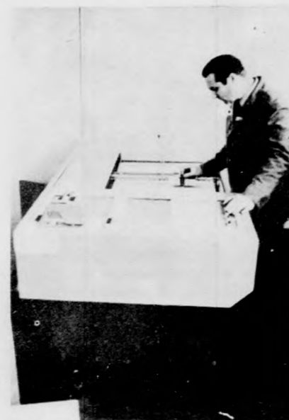
Az IYKANK főtervezője az automata rajzológép mellett.

A Belorusz Tudományos Akadémia kutatóinak munkája nyomán elkészült az IYKANK nevű automata rajzológép, mely lyukszalagos programozó berendezés vezérlésével, emberi kéz beavatkozása nélkül készíti el a műszaki terveket, az emberi munkát sokszorosan felülmúló teljesítménnyel. A bonyolult automatikai elemekből álló rajzófeje a lyukszalagon rögzített utasításokat követve látja el a feladatát. Ezzel egyszerűsödik ugyan, a konstruktorra háruló mechanikus munka, de a lyukszalagra felvitt program elkészítését továbbra is neki kell elvégeznie.