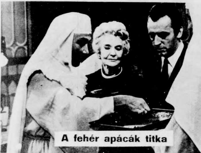
A fehér apácák titka

Zorba, a görög meghódította a világot, olyan lenyűgözően tudott szólni a munkáról, szerelemről, vidámságról és csüggedésről, az emberi élet nagy kérdéseiről. A Művész mozi jan. 29-től febr. 1-ig tüzte műsorára Kakoyannis alkotását.