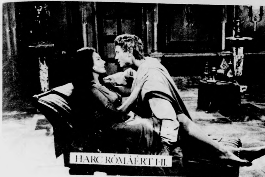
HARC RÓMÁÉRT FILM

Orson Welles és Sylva Koscina főszereplésével kétrészes, színes, szélesvásznú román-nyugatránémet történelmi kalandfilm. A Harc Rómáért szerepel az Apolló délelőtti műsorán jan. 29-től 31-ig. Vetítik még az Apollóban jan. 29-től febr. 4-ig délután, a Horváth Árpádban febr. 1-én és 2-án, a Klinikai mozikban febr. 1-én, a Meteorban pedig febr. 2-től 4-ig.