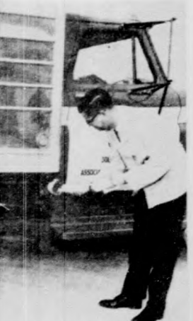
C fokos hőmérsékleten 15... az indítás.