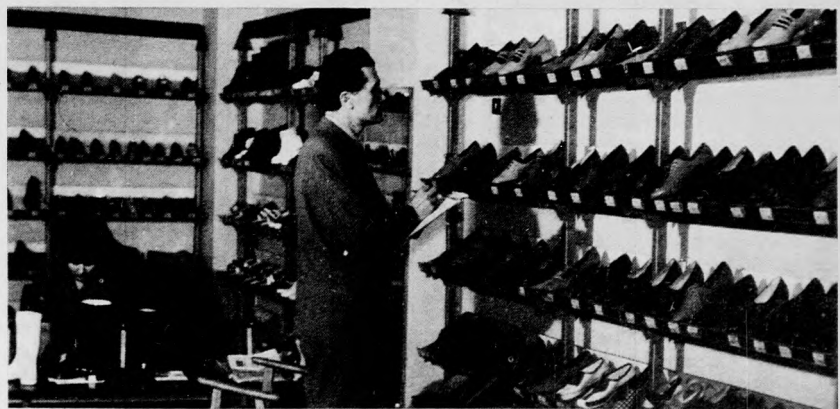
A Cipő-nagykereskedelmi Vállalat mintaboltjában mintegy 700-féle cipő között válogathatnak a kiskereskedelem szakemberei