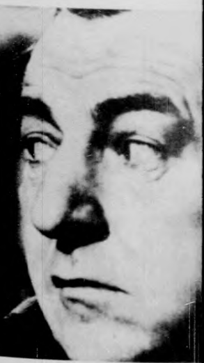
Maigret felülvé. Február 13.