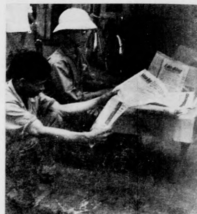
Miről ír az újság?

A honvédelmi készülség mellett az ifjúsági szövetségben a „hármass