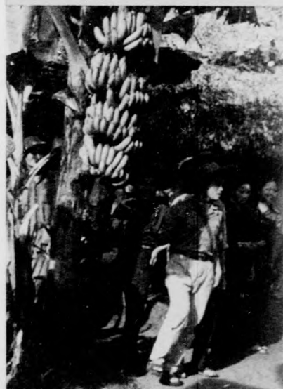
Fiatalok a banánfa alatt

forradalomra” összpontosítják a figyelmüket: a termelés forradalmasítására, a technikai és kulturális forradalom végigvitelére. Ugyanarra a kérdésre kaptam itt választ, mint Deo Nai antracitbányájában. Sok nehézséggel kell megküzdnie a termelésben, a többi között a nyolcórás munkaidő megfelelő kihasználásáért is. Nemesgyzer kényszerpihenőt tartanak a munkások, mert vagy nem kapják meg az importanyagot, vagy nincs pótkalkatész, lassan megy a gépjármű. A jó munkaszervezést segíti az is, hogy különböző tanfolyamokra, tapasztalateserekre küldik a fiatal munkásokat: ismerjék meg, másutt hogyan, miképp csinálják jobban.