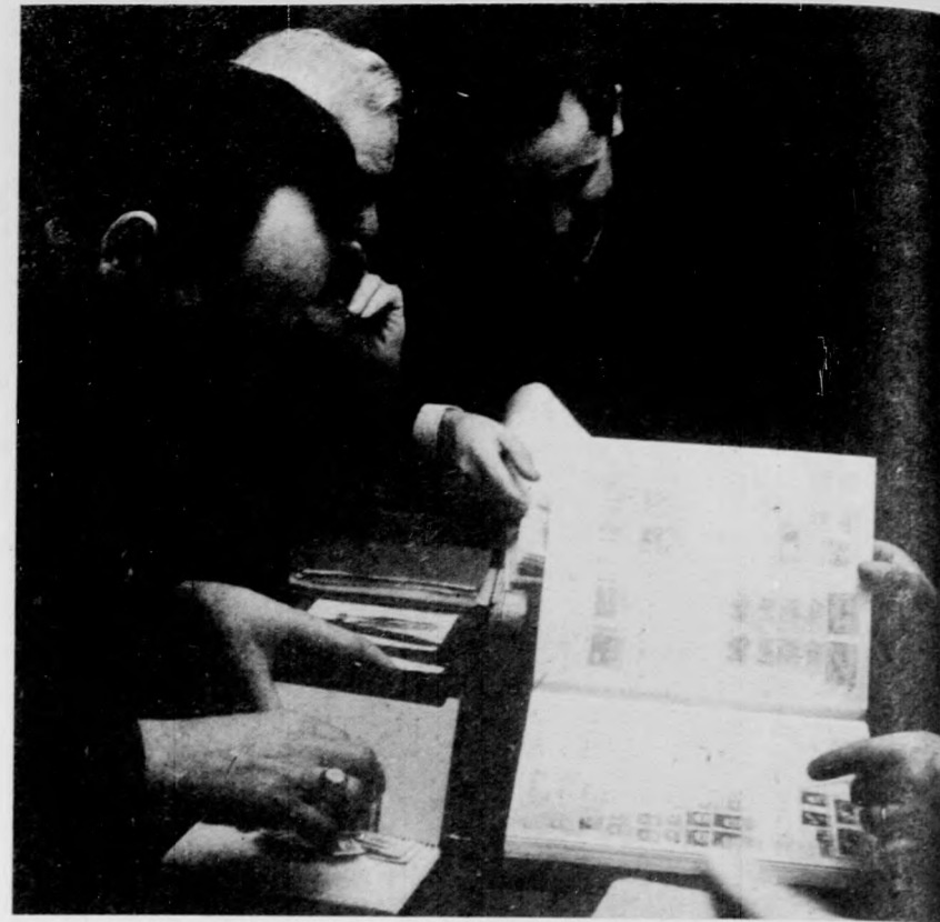
Vasárnap délelőtt Debrecenben, a bélyeggyűjtők klubjában

A XX. SZÁZAD KAMARAZENEJE címmel rendezi Debrecenben az I. „C” bérleti hangversenyt a Kodály teremben az Országos Filharmonia. Szerdán este a hangversenyen Berkes Kálmán, Hevesi Judit, Körömdi Klára, Mező László, Szalay József, Sziklay Erika és a Weiner-vonósnyegyes működik közre.