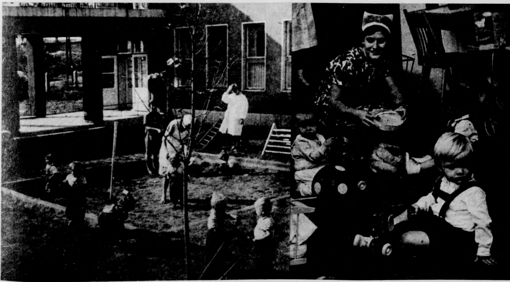
Az ő gondjuk már megoldódott. De a társaik száza még óvodára várnak

Írta: Juhász Judit Király Ferenc