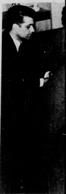
Aláírás előtt r