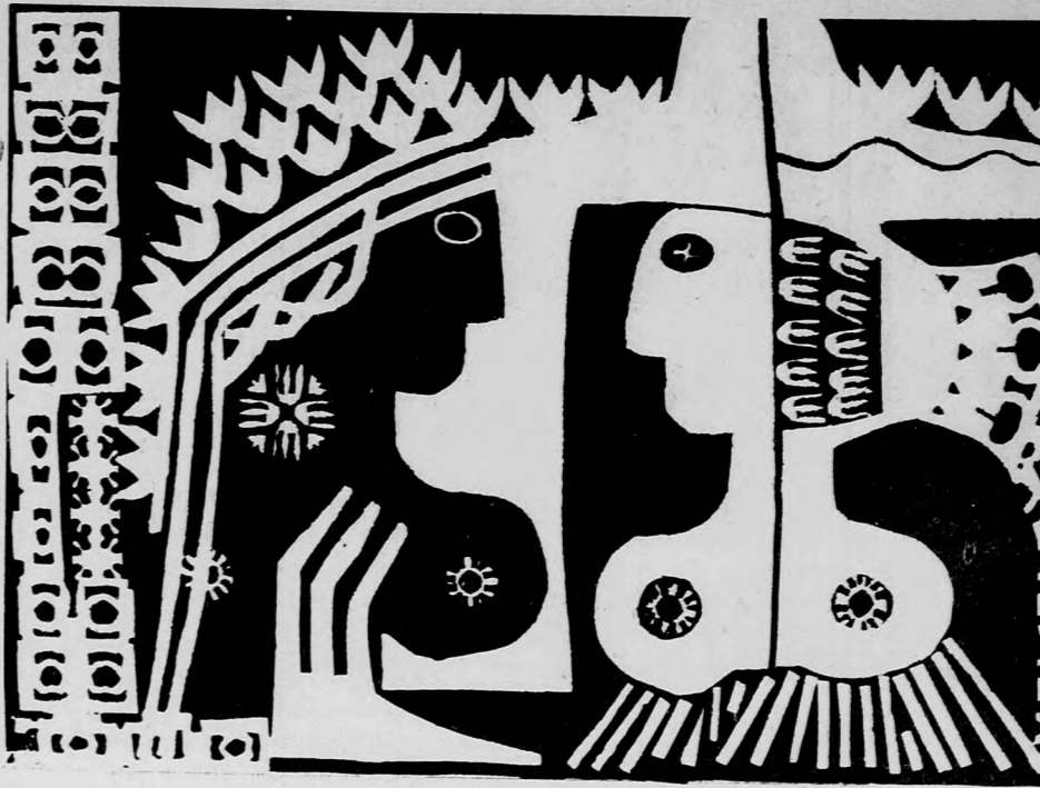
CS. UHRIN TIBOR GRAFIKÁJA