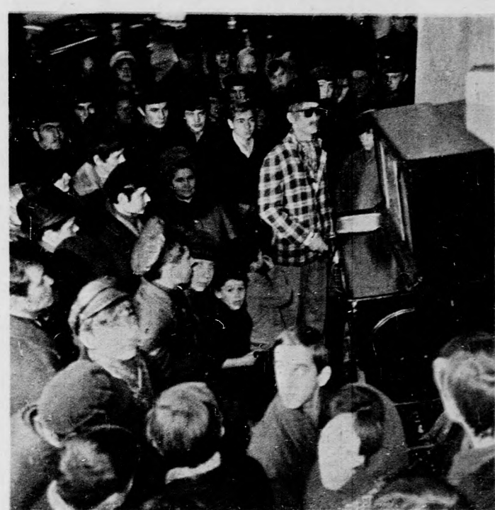
NAGY SIKERE VAN A VERKLINEK

Kellemesen lepte meg a nőket az 1840-es esztendő farsangja. Különösen fényes volt a pesti színházi bál, de még emlékezetesebb volt az asszonyi egyesület bálja, amelyet utcai ruhában táncoltak végig a hölgyek. A pesti úrnők, tekintettel az akkori posta lassúságára, már december elején megrendelték öltözékeiket. Nagy izgatottsággal tapasztalták, hogy nem érkezik semmi csomag. Végre eljött a báli nap, az este is. A redout bérlője fényesen kilavilágította a termeket. Tíz, majd