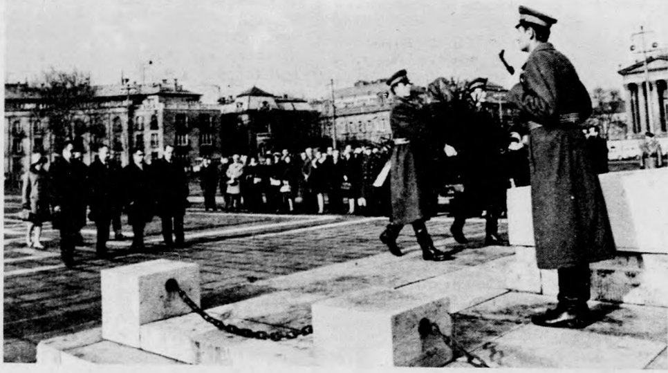
Koszorúzás Debreczenben, a Köztetetőben levő szovjet hősi emlékműnél

Dr. Lubomír Strougal, a Csehszlovák Szocialista Köztársaság szövetségi kormányának elnöke Budapesten kedden délelőtt megkoszorúta a Magyar Hősi Emlékművet.