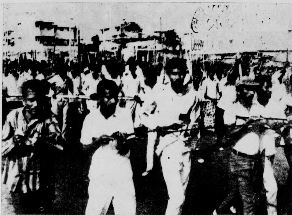
Igy kezdődött... Kerülő úton most érkezett kép a daccai véres események előjátékáról. Lánczakkal felfegyverzett kelet-pakisztáni tüntetők országrészüket függetlenségét követelik.

Hétfőn délután a francia hírügynökség (AFP) azt jelentette, hogy a „szabad Bengália” rádióadó megállapította, hogy „az emberiség történetében még sohasem követtek el annyi brutalitást egy fegyvertelen nép ellen, mint Kelet-Pakisztánban. A rádió ugyanakkor ismételt felhívással fordult a világ népeihez, az összes demokratikus országhoz, hogy segítsék Rahman sejkot a szabadságról vívott küzdelemben”. Új Delhiből jelentette a Magyar Távirati Iroda, hogy az indiai parlament 150 tagja tüntetett Delhiben a pakisztáni főbiztos hivatala előtt. A tüntetők jelszavaikban követelték: „El a kezekkel a bengáli néptől!” A tüntetőket a főbiztos nem fogadta, nem vette át