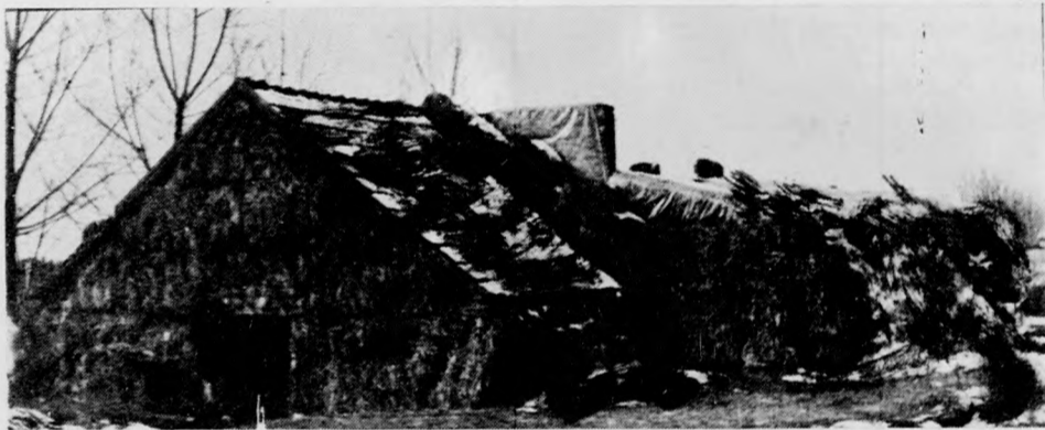
Ilyen kívülről. S bent a burgonya egészségesen, jól tárolható.