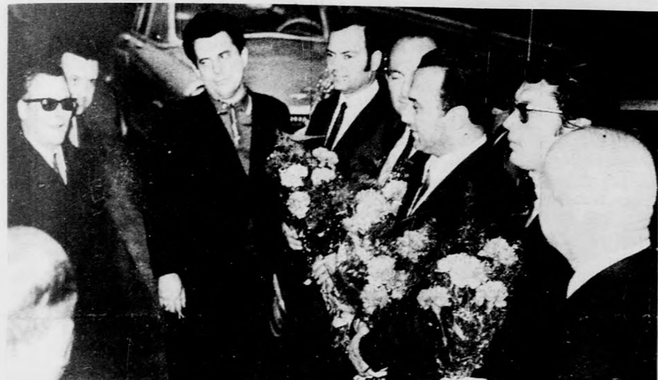
Fogadás a megyehatáron