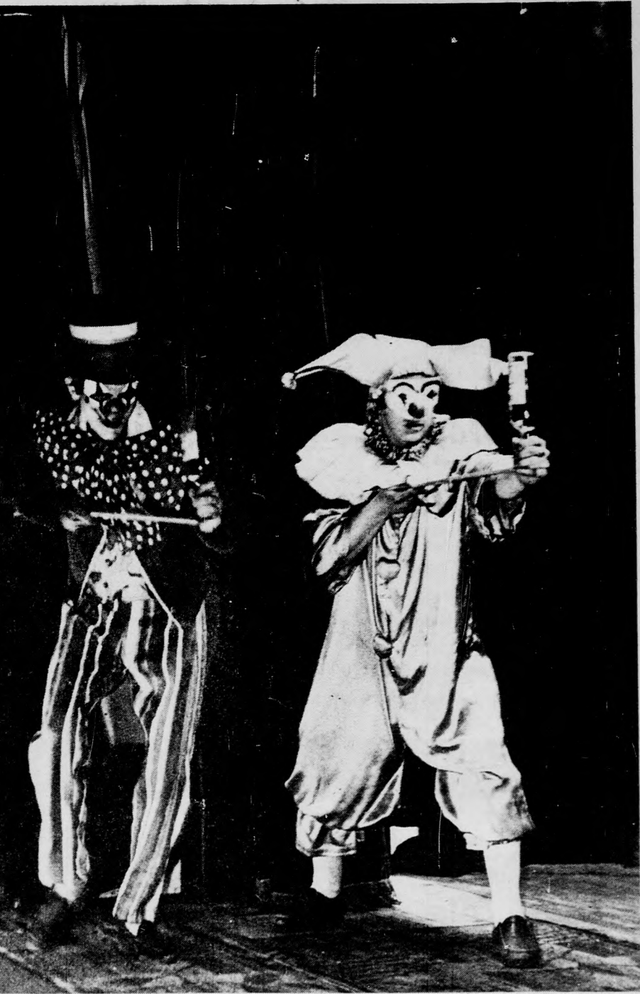
Jelenet a Ludas Matyi együttes műsorából