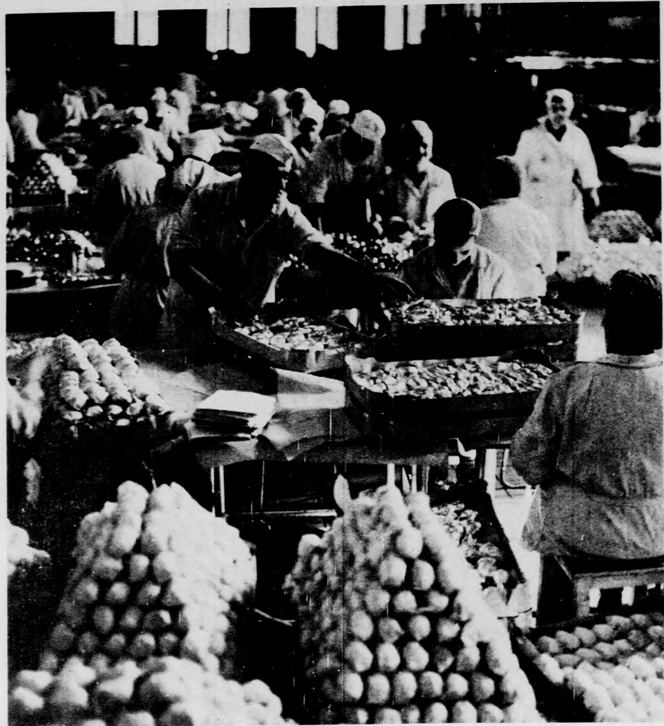
Húsvéti édesség — minden mennyiségben