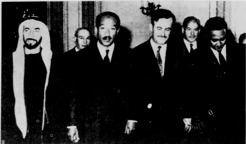
A tripoli egyezmény négy tagországa — Egyiptom, Szíria, Líbia és Szudán — államfői Kairóban. Kép: Szadat elnök a kairói Abdin-palotában fogadást adott a magas rangú vendégek tiszteletére.