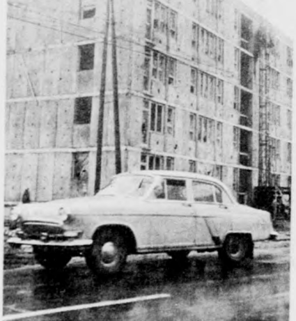
Debrecenben további 120 lakással bővül a Szabadság úti lakótelep. A lakások átadása még ebben az évben megtörténik.

HALFOGÁSI VERSENYT RENDEZ a debreceni Vasutas és Postás Horgász Egyesület április 18-án a Hortobágy folyón. A versenyzők a debreceni nagyjárművel vasárnap a 6 óra 28 perces vonattal indulnak. A nevezési díj 15 forint, ezért az összegért ebédet is kapnak a résztvevők. A jelentkezéseket április 16-ig kell eljuttatni az egyesülethez.