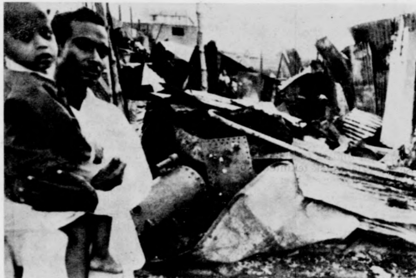
Kelet-Pakisztánban folytatódik a polgárháború, az éhség és a betegségek szomorú időszeke. Képünkön: romok Daccában.