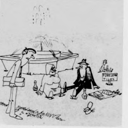
Camping a debreceni Petőfi téren. — Az önkényelmét is az BUSZ biztosítja?

HALFOGÁSI VERSENYT RENDEZ a debreceni Vasutas és Postás Horgász Egyesület április 18-án a Hortobágy folyón. A versenyzők a debreceni nagyjárművel vasárnap a 6 óra 28 perces vonattal indulnak. A nevezési díj 15 forint, ezért az összegért ebédet is kapnak a résztvevők. A jelentkezéseket április 16-ig kell eljuttatni az egyesülethez.