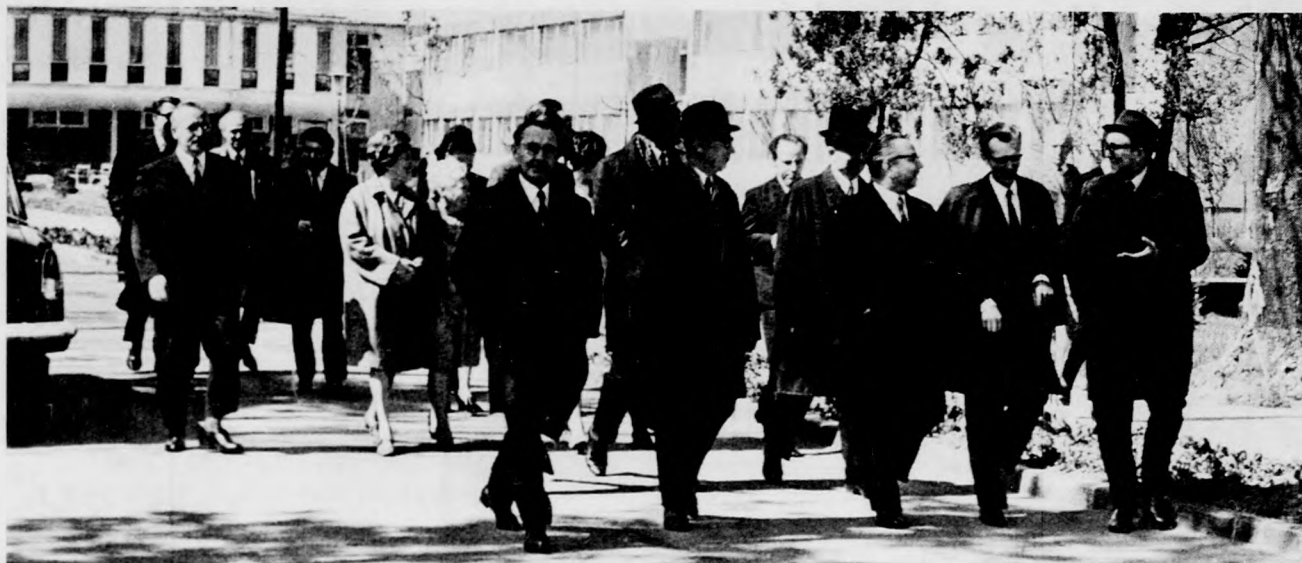
Kállai elvtárs és kísérete a berettyóújfalui kórház látogatásán