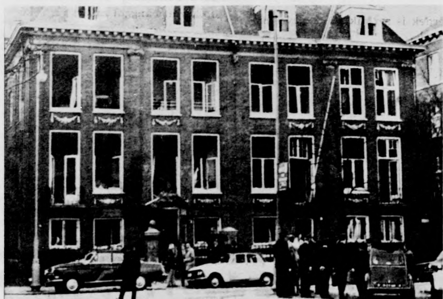
Nyugat-Európában sokasodnak a fasiszta merényletek: a stockholmi jogszláv nagykövet meggyilkolása után most Amsterdamban, a szovjet külkereskedelmi képviselő épületében robbant bomba. Képünkön: a rendőrség emberei a helyszínen.

hírugynökség tudósítójának kijelentették, hogy a kelet-pakisztáni hattagú kormány csütörtökön teszi le az esküt.