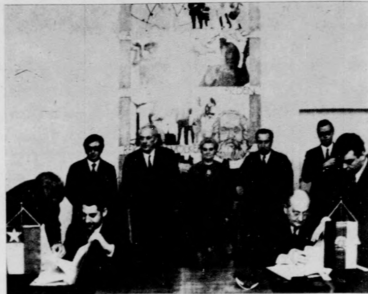
A chilei kormány következetesen folytatja külpolitikai programjának megvalósítását is. Ennek egyik fontos állomása volt a Chile és az NSZK közötti diplomáciai kapcsolatok felvétele. Képünkön az erről szóló dokumentumokat írják alá Berlinben. Jobbra Otto Winzer, az NSZK külügyminisztere, balról Alcides Leal Osoiro chilei külügyi államtitkár.