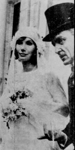
A „Forsyte Saga” című film. (A Tv április 21-i n

9.08 Felsőfokú matematika. Aranykapu. 10.50 A korszerű. 11.55 Amerikai komédiák. Hu- met nyelvtanfolyam. 15.40 16.45 Górra, az ördög. Franci- áhárítás. A DIVSZ jubileum. Gyarmati Ifjúság Napja alká- kat ajánljuk! 18.05 Tv. Opera. Sporthírek. 18.40 Esti mese. 1. rész: A családi esküvő. 20.5. 21.20 „Kicsoda? — Micsoda?”