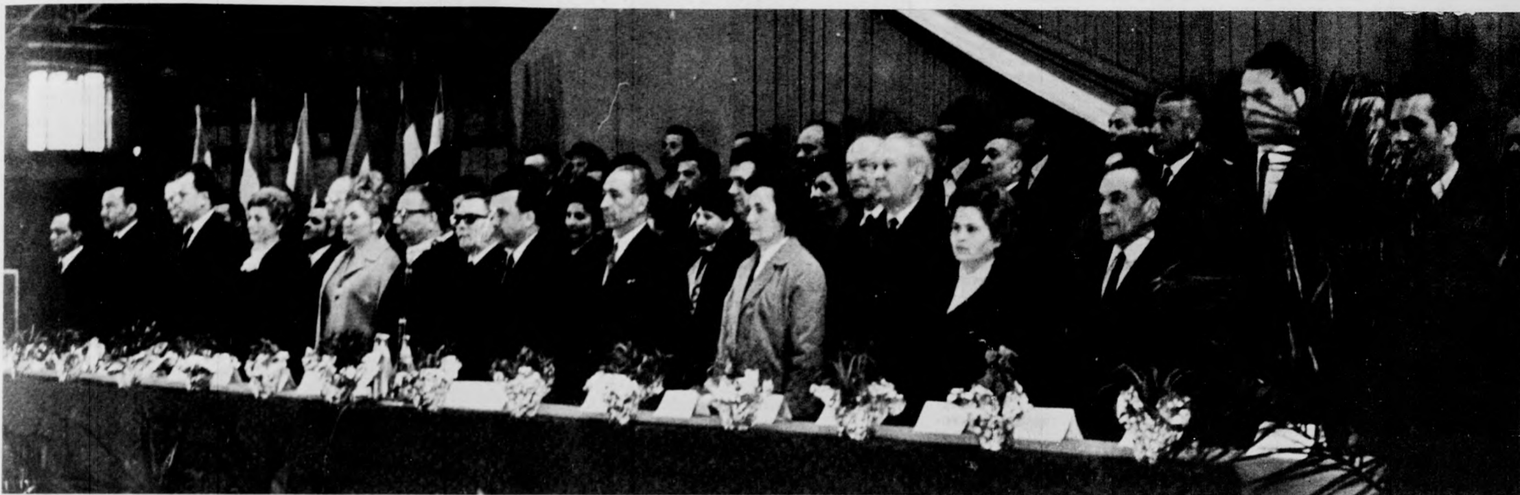
A nagygyűlés elnöksége

Választási nagygyűlés a MÁV Járműjavító Üzemben