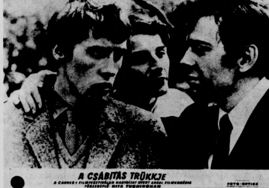
„A csábítás trükkje” című angol film. (A Tv április 24-i műsora)