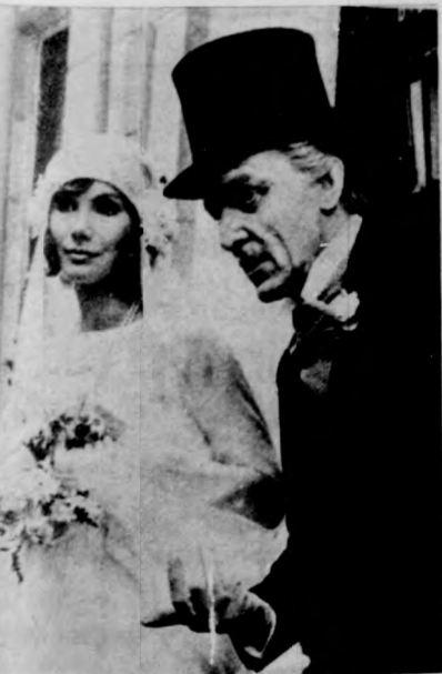
A „Forsyte Sag:” című folytatásos film. (A Tv április 21-i műsora)