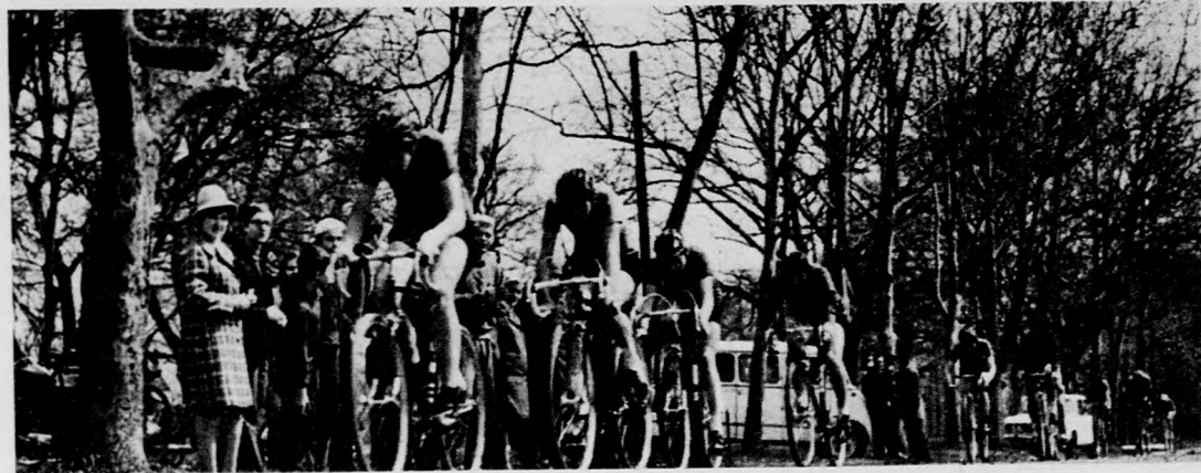
Táposkák a pedált a vaskerekesek

A Magyar Testnevelési és Sport-szövetség Hajdú-Bihar megyei Tanácsa az 1971-72. évi segédedzői tanfolyamra felvételt hirdet. A tanfolyamra — valamennyi sportágban — a 18. évet betöltött, legalább általános iskolai végzettségű és gyakorlati jártasságú bíró volt vagy jelenlegi sportolók jelentkezhetnek. A jelentkezők elméleti tájékoztatóból és a sportágnak megfelelő mozgáskövetelményekből felvételi vizsgát tesznek, ennek alapján vehetnek részt az 1971 őszén kezdődő tizhónapos elméleti tanfolyamon (havonta egy-egy alkalommal). A tanfolyamon sikeres vizsgát tett hallgatók a sportolói függően 10-15 napig tartó gyakorlati táborozáson vesznek majd részt. Ennek eredményes befejezése után oklevelet és edzői igazolványt kapnak, melyek segédedzői fokozatú és mellékfoglalkozási edzői tevékenység-re jogosítanak. A segédedzői tanfolyam iránt az MTS megyei tanácsa bővebb felvilágosítást is ad. Jelentkezni május 10-ig lehet az MTS területileg illetékes tanácsánál.