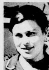
A GYÁRI MUNKÁS NŐ

— Igaz, hogy nem vagyok nánási, azonban a gyermekeim már itt születtek, ők már tősgyökeres haj-