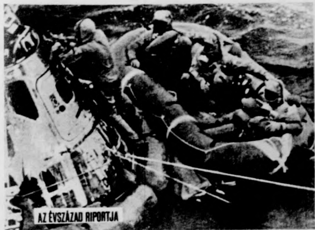
AZ ÉVSZÁZAD RIPORTJA

Világiskert aratott, nagyhírű film kerül a Művész mozi műsorára április 22. és 25. között. Csak 16 éven felüli nézők számára vetítik a Zabriskie Point című színes amerikai filmet, Antonioni Amerikában készült alkotását.