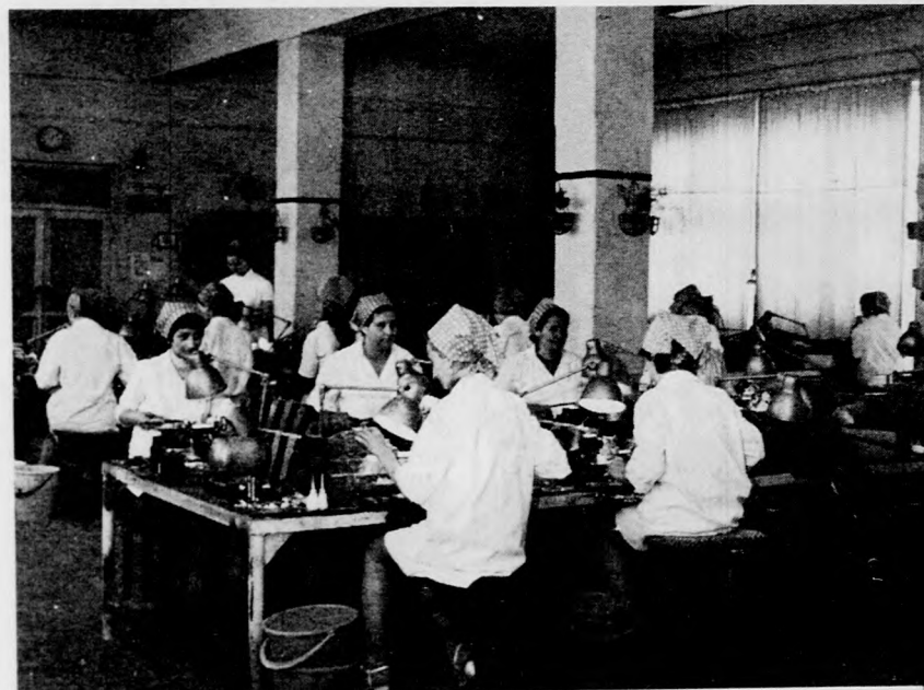
Főként asszonyok dolgoznak a Vegyipari Javító és Szolgáltató Vállalat püspökladányi gombüzemében.

Tegyük mindehhez: Püspökladányban nemcsak a püspökladányi lakosok igényeit kell kielégíteni. Ladány természetes központ.