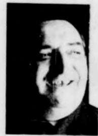
A KOLLÉGIUM IGAZGATÓJA

Hajdúnánás is fejlődik: épül, szépül, gyarapodik. Épülnek a modern, új bérházak, új ipari létesítmények, üzemelnek, bővülnek a régiék. S ebben a gyarapodásban nagy részük van a tanácsoknak, akik napi munkájuk, mindennapos teendőik mellett még pluszban vállalják, hogy a fontos döntéseknél képviselik körzetük lakóit, előrébb lendítik lakhelyük sorsát. Két tanácstagjelöltet mutatunk be: mindkettő hajdúnánási, mindkettő lelkes odaadással készül arra a munkára, amelyiket megválasztásuk esetén végezniük kell majd.