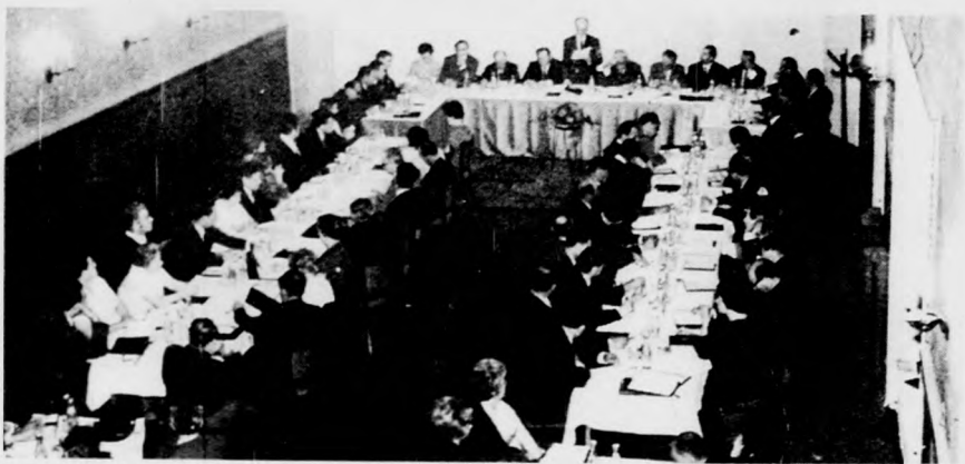
A küldöttközgyűlés résztvevői

A Hajdú-Bihar megyei Kisipari Termelőség-szövetkezetek Szövetségének küldöttközgyűléséről