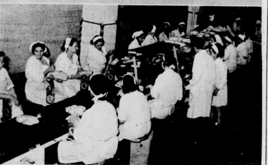
Munkában a csomagolók

A vállalat Diószegi úti telepén a pecsenyekacsa feldolgozásával egyidejűleg indult meg a pecsenyelibaszés is. Érdekes megemlíteni, hogy a debreceni vállalatnak ez a terméke egyre keresettebb a nyugati államok piacain. A magas felvásárlási ár miatt a nagyüzemi gazdaságok szívesen tartják a libát.