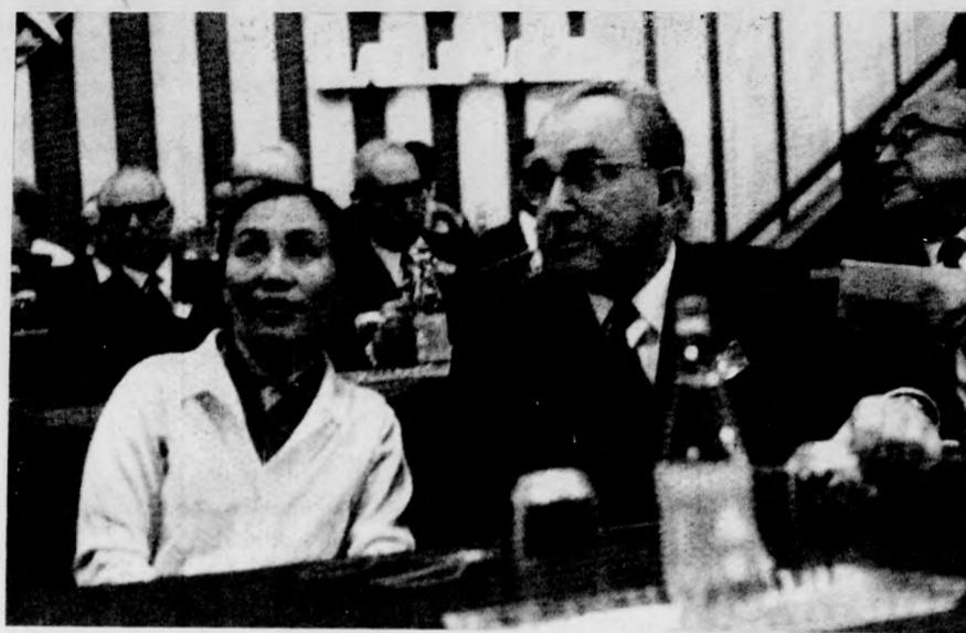
Pillanatkép a BVT budapesti közgyűléséről: két világhírű személyiség, Nguyen Thi Binh asszony, a DIFK külügyminisztere és Alekszander Kornyejevuk szovjet drámaíró, a Szovjetunió Legfelsőbb Tanácsának tagja.

Valamennyi szekcióban képviselteti magát a magyar békebizottság. Az európai biztonság kérdésével foglalkozó bizottságban ajánlásokat terjeszt be a magyar békebizottság. A javaslatok között szerepel, hogy az európai béke és biztonság megteremtéséért — félretéve a nézeteltéréseket — meg kell valósítani kontinensünk bekezdéseinek e széles körű összefogását. A magyar békebizottság szorgalmazza a BVT-nél, hogy valamennyi európai békeerővel karöltve segítse elő az európai biztonságért folytatott harcot. Az európai népek támogatásával két- és többoldalú megbeszélések kell szorgalmazni a kollektív biztonsági rendszer megteremtéséért. Ugyancsak sürgető teendő — s ez szintén hangot kap a magyar javaslatok között —, hogy a BVT és valamennyi nemzeti békebizottság a rendelkezésére álló eszközökkel, összehangolt demonstrációkkal együttesen lépjen fel, küzdjön a szovjet-nyugatnémet, valamint a lengyel-nyugatnémet szerződés ratifikálásáért.