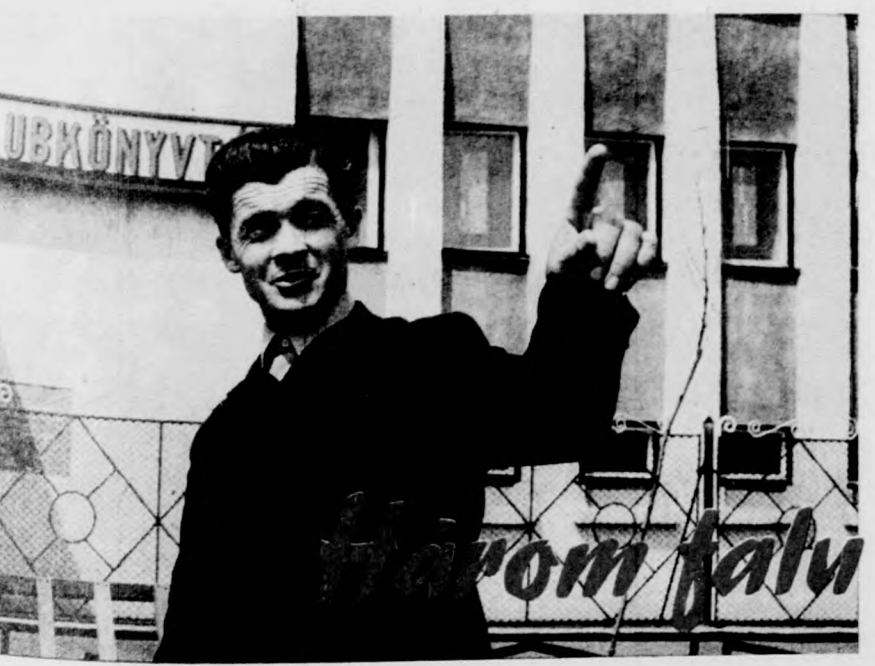
„És nézze meg itt a falu szélét”

Szeme körül összegyűrődnek a ránok: nevetni nem akar, a mo- solygást nem tudja eltitkolni: