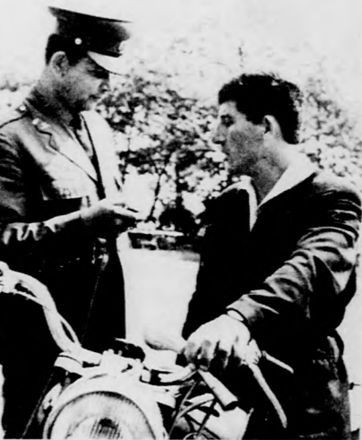
A „határsértés” nem maradt büntetlen