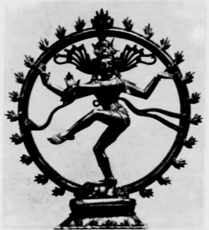
Táncoló Shiva — 17. század (bronzmásolat)

India politikai és gazdasági jelenéről elég sok információt kapunk, múltjáról és művészetéről csaknem semmit. Szükséges lenne pedig kultúráját is alaposabban megismernünk. Nemcsak India mai jelentőségéért, hanem hogy végre megtaláljuk saját kultúránk igazi helyét. Magabiztos fölényünkben kissé megingóva vegyük tudomásul: máshol is, más módon, de legalább olyan magas fokú kultúra létezett, mint Európában vagy az ókori Mezopotámiában.