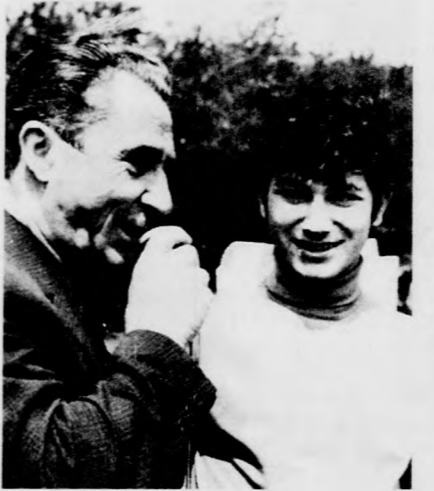
Az erdész jelenti: határsértőt vet- tek észre