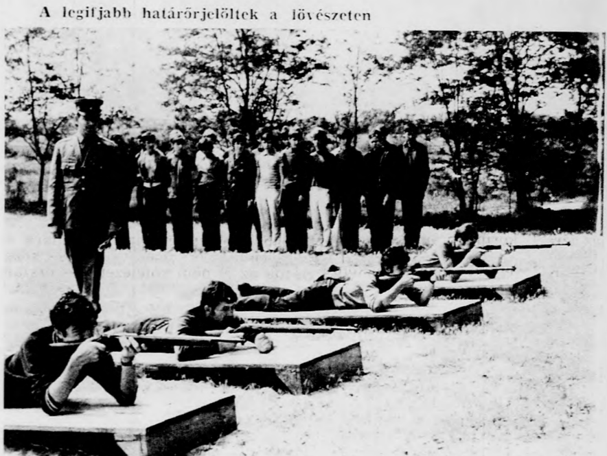
A legifjabb határőrjelöltek a lövészetben