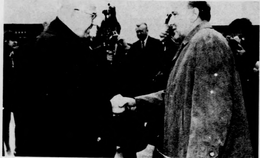
Dr. Gustáv Husák, a CSKP KB első titkára üdvözlö a repülőtéren Kádár Jánost

Kedden délelőtt megerkezett Prá- gába a magyar pártküldöttség.