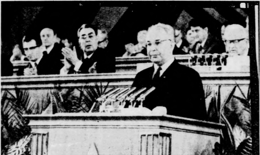
A prágai Fucik kultúrpark kongresszusi csarnokában megnyílt a CSKP XIV. kongresszusa. Képfőnök dr. Gustáv Husák, a CSKP KB első titkára a szónoki emelvényen. Mögötte: Svoboda államfő és Leonid Brezsnev.