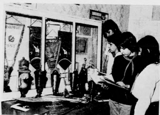
A jubileumi kiállításon