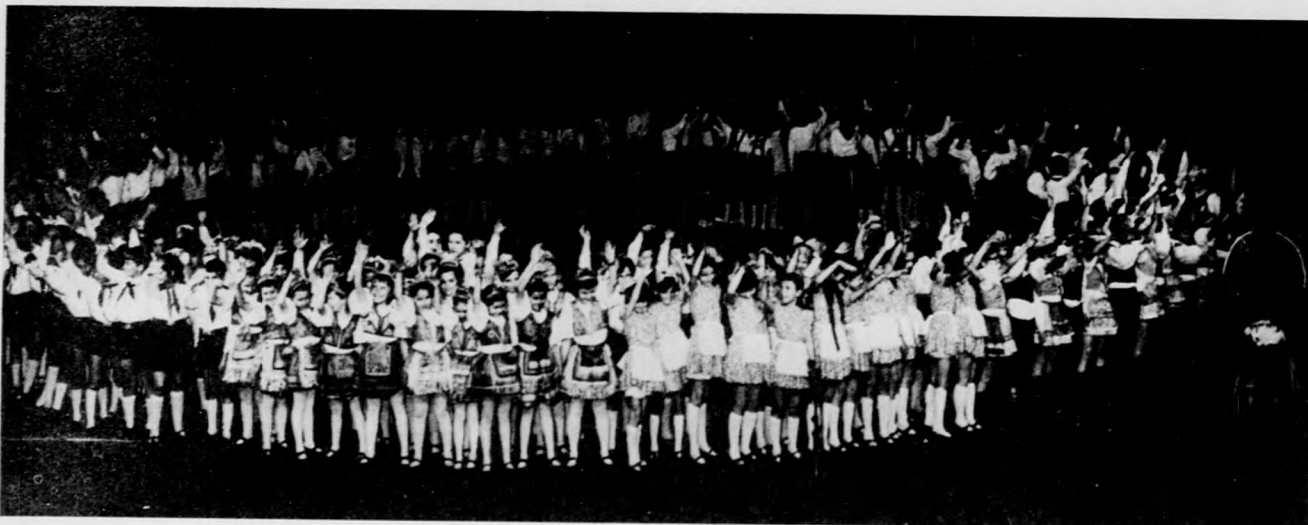
A kisdobosok seregszemléjének színpompás záróképe

LAKÁSRA VÁRÓK, FIGYELEM! A Debrecen városi Tanács I. kerületi hivatalának lakásügyi osztálya szombaton harminc napi időtartamra mind a három kerületi hivatalnál kifüggesztette az egész városra vonatkozó 1971. második félévi lakáselosztási tervet. Az elosztással kapcsolatosan bárki észrevételt tehet személyesen, vagy írásban az I. kerületi hivatal lakásügyi osztályán.