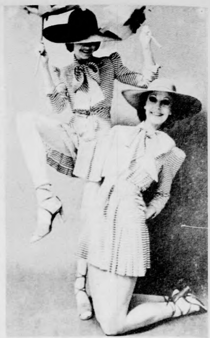
DIVAT — PÁRIZSBAN Jean Patou, a híres francia divattervező tavaszi, nyári modellje látható a képen. Úgy látszik, ő teljesen minipárti...