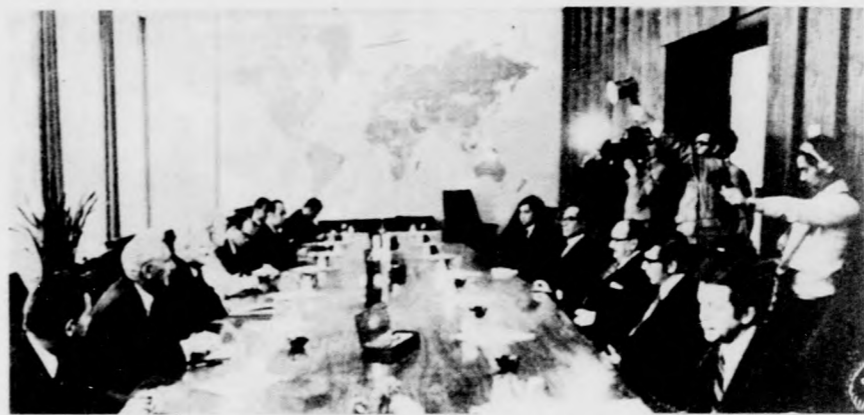
A Clodomiro Almeyda Medina külügyminiszter vezetésével Berlinben tartózkodó chilei küldöttség megkezdte hivatalos tárgyalásait az NDK fővárosában. Balról a 3. Otto Winzer, az NDK külügyminisztere, jobbról a 3. a chilei külügyminiszter.