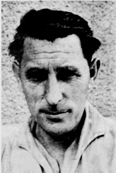
Kelemen Károly brigádfőnök