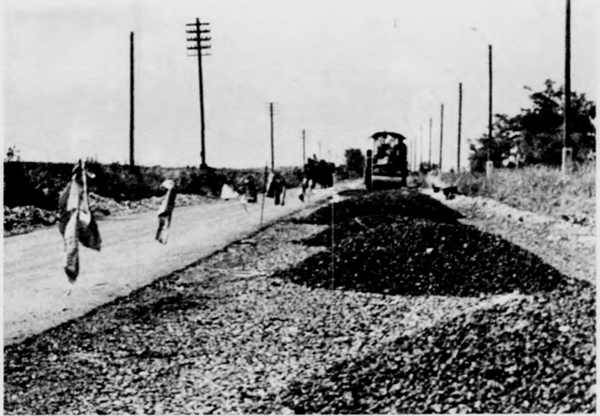
A Debreceni Közlekedési Vállalat végre elkezdte a Kishegyesi úton megindult, a téglagyár és műanyaggyár közti szakaszának kijavítását, illetve új burkolat készítését.

Egyébként a Textilfeldolgozó Vállalat KISZ-esi társadalmi munkában kívánunk segíteni az ifjúsági park és a csónakázó tó építésében, valamint az óvodákban és bölcsődékben használt textilfelszerelések megváltásában is segítenénk. A fiatalok vállalatukkal a KISZ-hamarosan összeülő VIII. kongresszusát kívánják köszönteni.