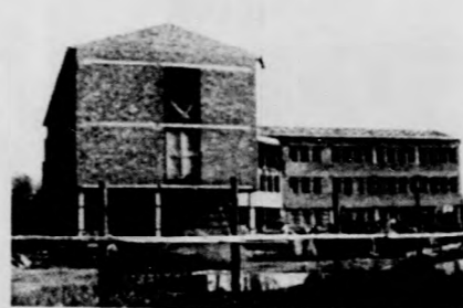
Az oldalt összeállította: Domokos Lajos