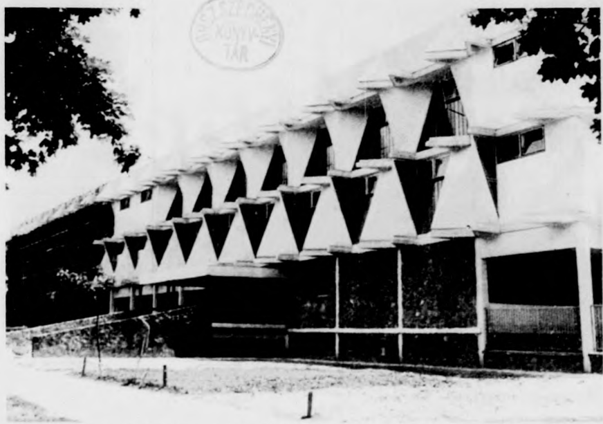
Készül a Nagyerdei Gyógyfürdő Nagyerdei körút felőli új öltözős-ráncok homlokzata. Az új épület első felének műszaki átadása csütörtökön történt meg.

S hány és hány ilyen zárandokhely van az országban. Sokszor több is, mint ahányról tudunk, és sokszor még azokat is elkerüljük, amelyekről tudomásunk van. Nos, ezt kell felcserélni diákjainkban, fiataljainkban, ezekhez a helyekhez kell hogy oda tudjunk menni a szeretetűk. S különösen ilyenkor, a nyári szünetben, amikor az országjárás élményként is a legszebbek közé tartozik.